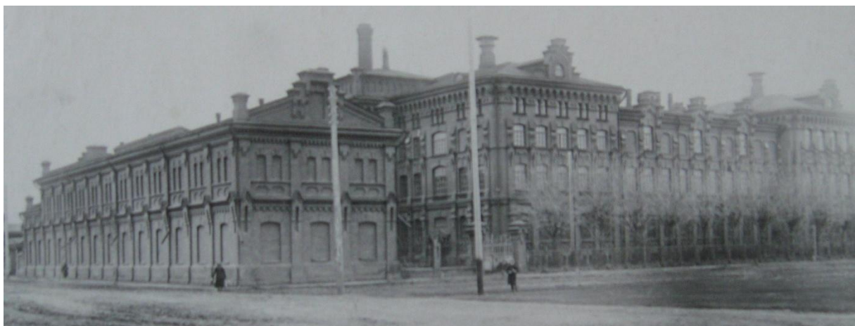
Рис. 4. Здание главного корпуса Красноярского казенного винного склада. Фотография начала XX в.

За богато декорированными фасадами зданий заводов в романтично-средневековых образах скрывалось совершенно иное внутреннее пространство, разделенное междуэтажными ярусами, соответствовавшими технологическим процессам. (Рис. 4)