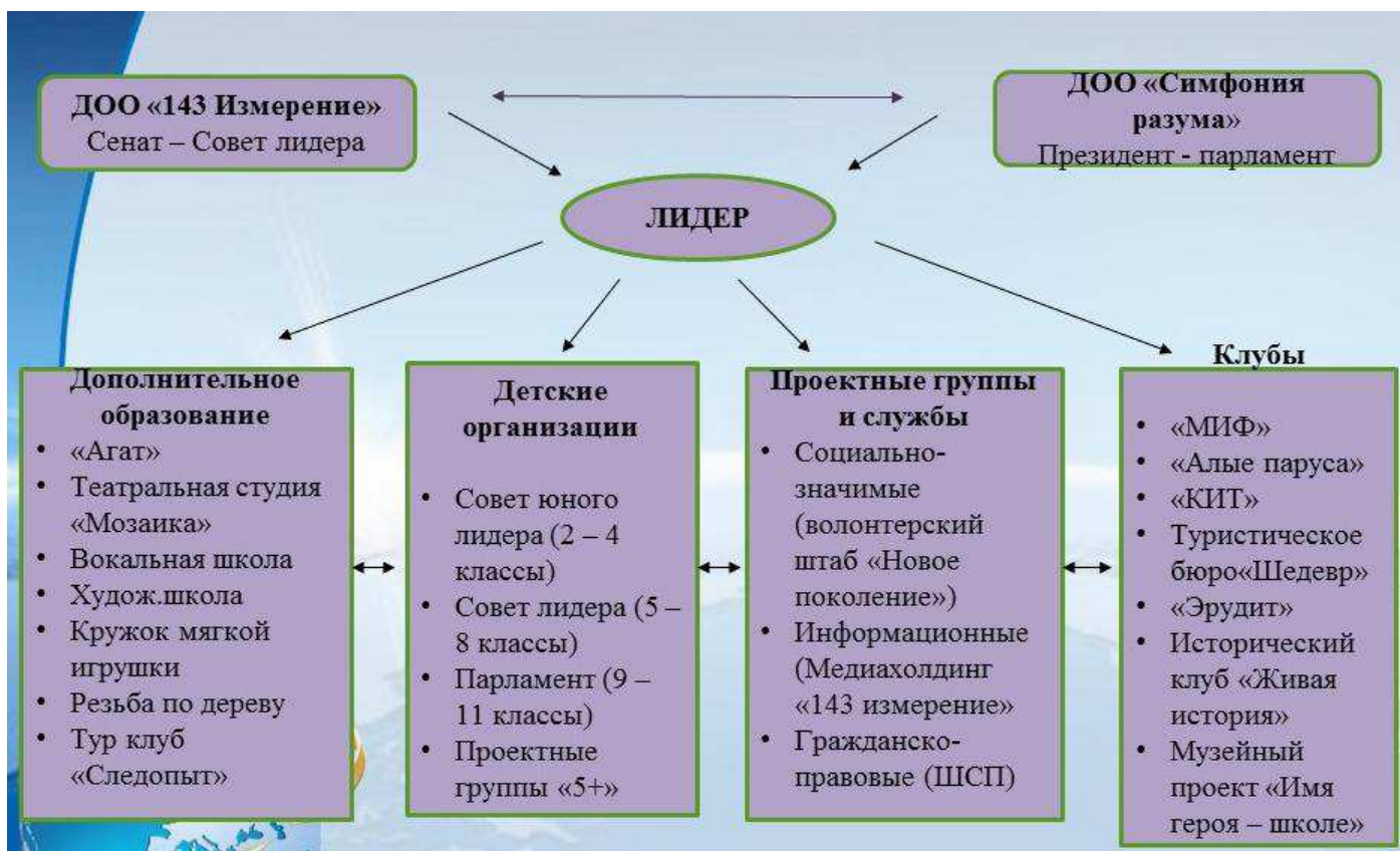
Рисунок 2 – Детские общественные объединения MAOU СОШ № 143

Школьный интеллектуальный клуб – добровольное творческое объединение учащихся, стремящихся совершенствовать свои знания в определенной области науки, искусства, развивать свой интеллект.