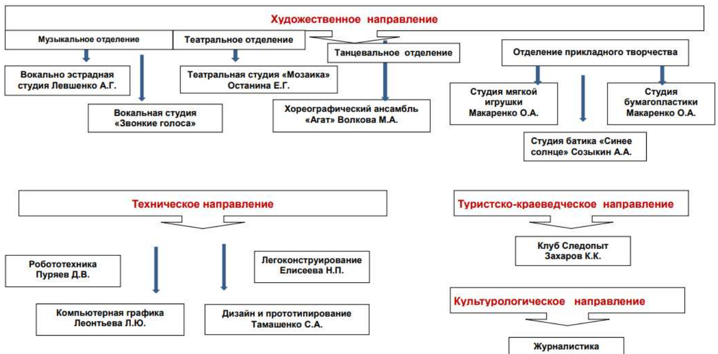
Рисунок 1 – Дополнительное образование в школе, реализующееся через разнообразные формы досуга как средство профилактики отклонений в поведении учащихся

Важно отметить, что в школе ведет работу Школьная служба примирения. Основная цель - это создание условий успешной социализации учащихся, снижение количества конфликтов через реализацию восстановительных технологий в системе профилактики правонарушений и конфликтных ситуаций в школьной среде.