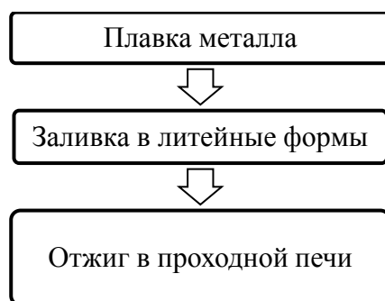
Рисунок 2 - Схема технологического процесса производства продукции в литейном цехе

После обработки продукции в литейном цехе, следом она попадает в прессовый цех, на следующий этап.