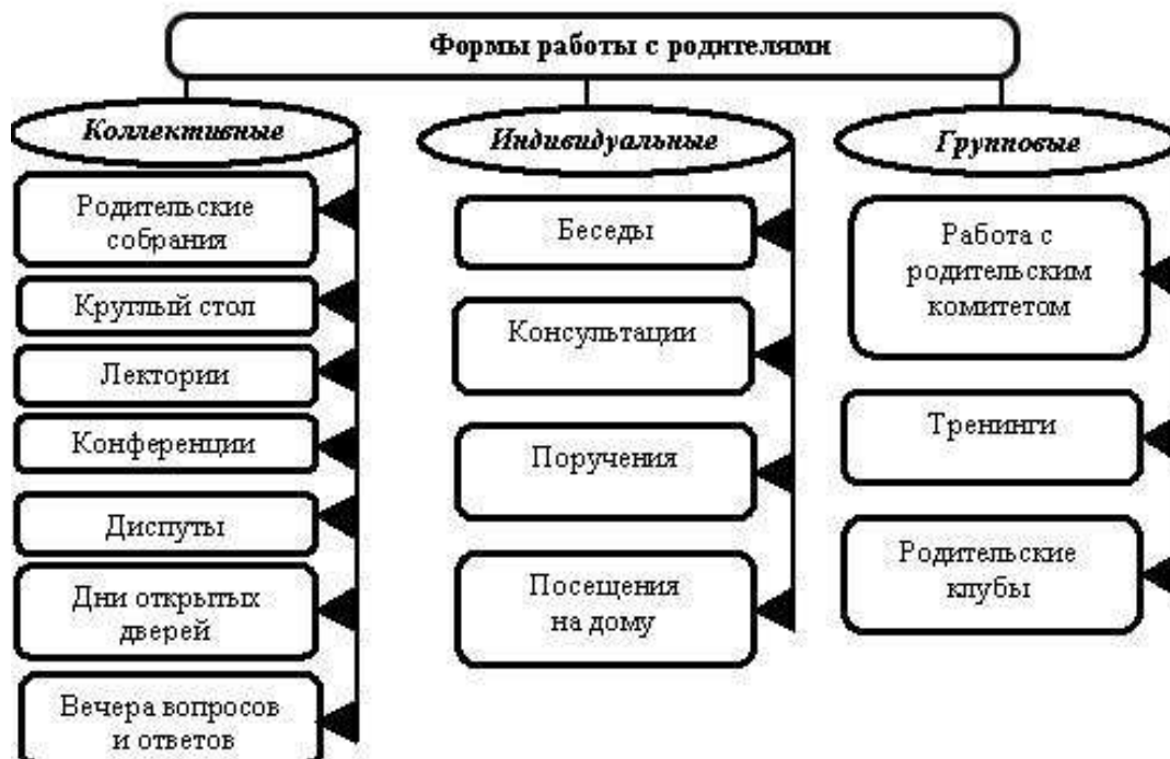
Рисунок 1- Формы работы ДОУ с родителями .

Таким образом, традиционными формами вовлечения родителей в образовательный процесс ДОУ являются родительские собрания, дни открытых дверей, вечера вопросов и ответов, консультации, беседа, работа с родительским комитетом. Взаимодействие ДОУ и семьи представляет собой взаимную поддержку, совместную деятельность по реализации воспитания ребенка.