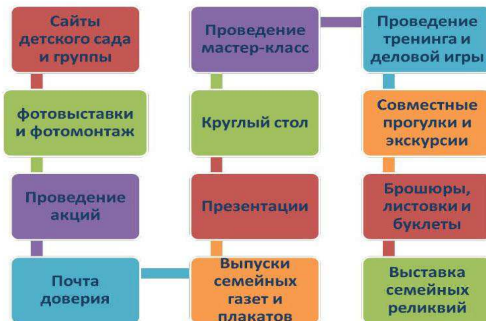
Рисунок 2. Инновационные формы взаимодействия

Таким образом, использование инновационных форм и взаимодействия воспитателей с семьей способствует повышению эффективности работы с родителями.