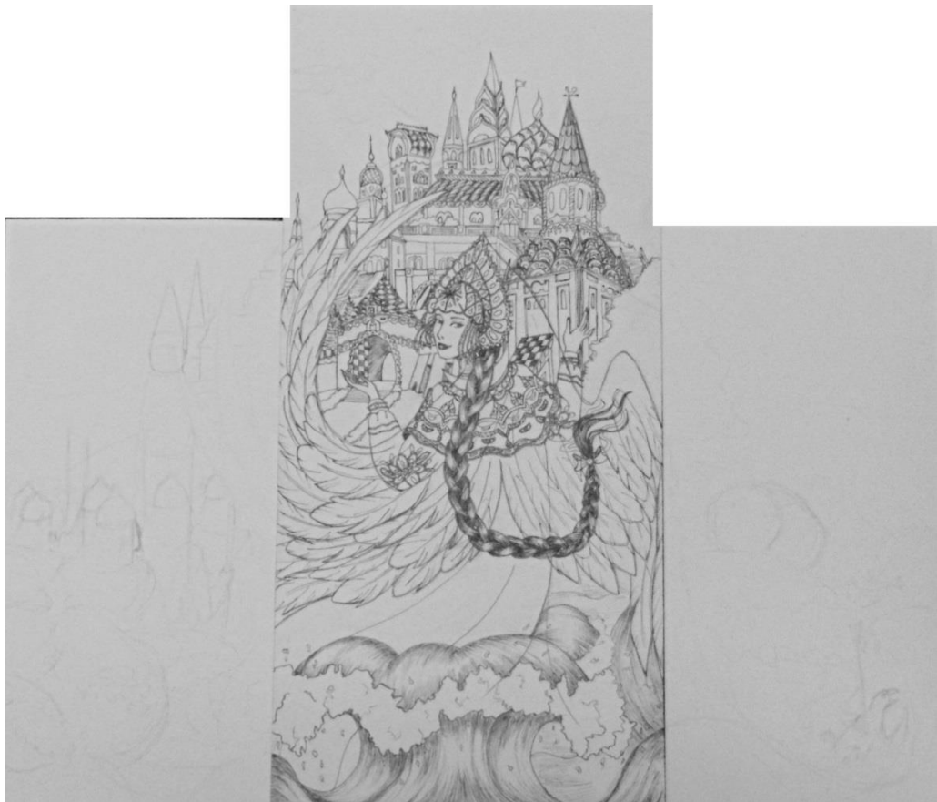
Третий графический эскиз