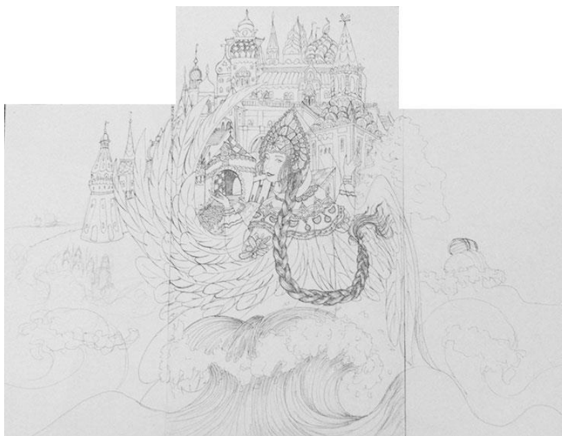
Первый графический эскиз.

По ходу изучения различного материала шел процесс эскизирования. Вначале разрабатывалась композиционная схема с помощью небольших набросков и линии. С помощью подобных непроработываемых набросков – вышла к основной композиции. Дальше шел кропотливый и долгий процесс выполнения графического эскиза, где менялись размеры, сама композиция и расположение некоторых персонажей, а так же добавление этих самых некоторых персонажей. После этого шла долгая работа над цветом.