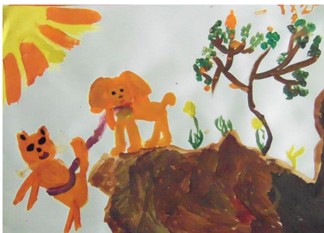
Хованская Таисия «Ярик-спасатель»