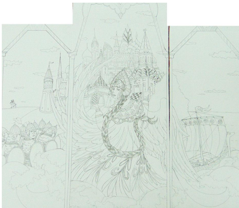
Второй графический эскиз.