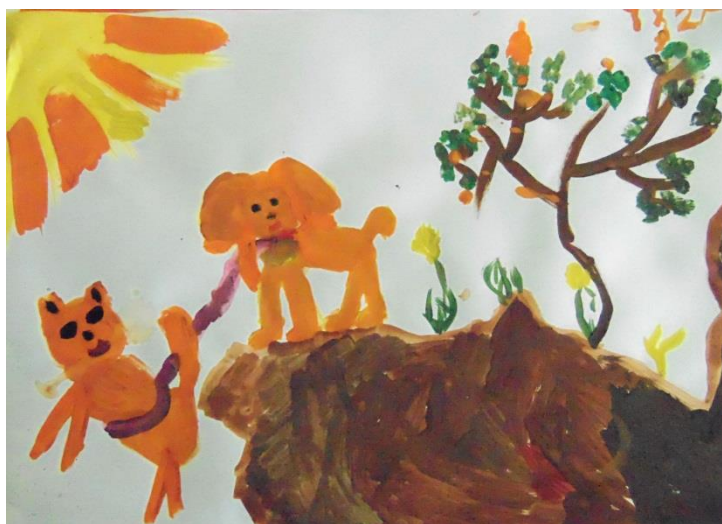
Хованская Таисия «Ярик-спасатель»

25.05.2017 – Итоговое занятие заключалось в том, что мы с учениками заканчивали то, что не успели на прошлом занятии, а после подводили итоги. Дети по желанию рассказывали выдуманные ими истории, рассказывали о своих героях, что они умеют делать и что они делали на изображенных ими иллюстрациях. Подвели итоги. Дети рассказали о своих впечатлениях после проведенных мною уроков.