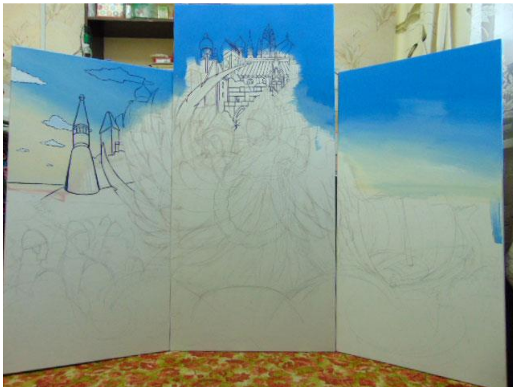
Начало работы со цветом.