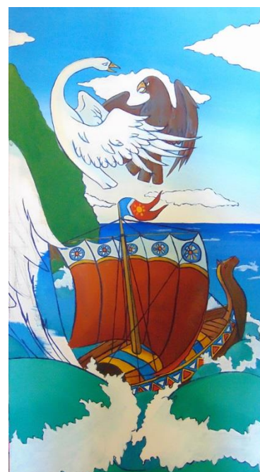
Продолжение работы со цветом.