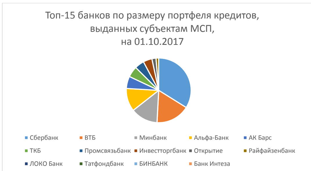
Рисунок 1 – Рейтинг банков по размерам портфеля кредитов, выданных субъектам малого и среднего бизнеса на 2017 год

Рынок МСП отличается высокой волатильностью. В период экономического подъема субъекты МСП стремительно развиваются, а в период спада так же стремительно теряют обороты. Это естественный процесс, потому что при сокращении оборотов крупные компании сокращают лимиты и объемы операций в основном за счет мелких подрядчиков. Для небольшого предприятия потеря даже одного крупного заказчика может оказаться летальной. Кроме того, мелкие предприятия более чувствительны к сокращению платежеспособности населения. Поэтому нестабильность на финансовых рынках, как внутреннем, так и глобальном, всегда отрицательно сказывается на активности кредитования субъектов МСП.