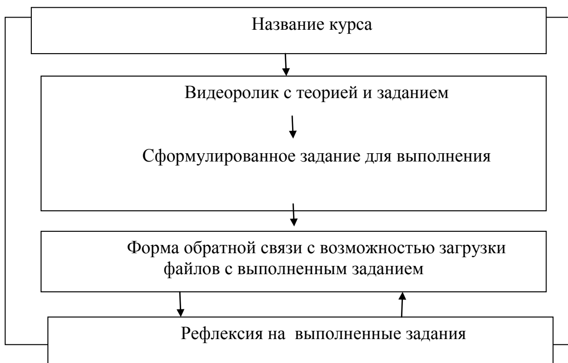
Рисунок 1 – Модель электронной образовательной платформы, реализованной как одностраничный сайт

Электронная образовательная платформа представляет собой одностраничный сайт, выполненный в современной технологии «landing-page» (см. рисунок 1), и состоит из 5 блоков, доступ к каждому из которых открывается только после заполнения формы обратной связи в конце блока. За каждое выполненное задание учащийся получает оценочный балл от эксперта блока, дающего теоретический материал. Теоретический материал на странице представляют популярные ведущие города Красноярска, ранее являющиеся выпускниками Гуманитарного института, Института педагогики психологии и социологии, а также Института филологии и языковой коммуникации СФУ.