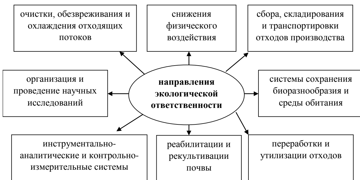
Рис. 1 – Направления экологической ответственности

содействуют повышению конкурентоспособности, снижению издержек, освоению новых рынков, повышению инвестиционной привлекательности. При этом значительная доля социальных результатов таких инвестиции предусматривает улучшение условия труда, рекреации и отдыха, снижение заболеваемости, увеличение продолжительности жизни. Можно утверждать, что конечной целью практической реализации технологических инновации природоохранной направленности является мультипликативный эффект инвестиций, проявляющийся в ресурсосбережении, минимизации негативного загрязнения, получении вторичного сырья. По международным стандартам устойчивое развитие обеспечивается благодаря процессам модернизации производства, позволяющими одновременно реализовывать широкий спектр направлений деятельности по соблюдению экологической ответственности (рис. 1).