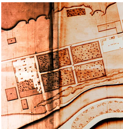
Рис. 1. Фиксационный план Красноярска 1827 г. Фрагмент. Российский государственный исторический архив. СПб.

В 1822 году Красноярск стал административным центром Енисейской губернии. Первый енисейский губернатор А. П. Степанов активно занялся благоустройством города. Он предпринял меры по составлению проектного плана Красноярска, который был завершен и получил «высочайше» утверждение в 1828 году. На плане определился новый общегородской центр – Ново-Соборная площадь, которая с южной стороны примыкала к участку лесного массива, сохраненному по предложению губернатора Степанова для устройства публичного сада. Следует отметить, что первоначальные границы этого участка, как показано на фиксационном плане города 1827 года, определялись с северной стороны Воскресенской улицей (ныне проспект Мира), а с южной – берегом Енисея. Восточная граница участка проходила по направлению современной улицы Диктатуры Пролетариата, а западная – вдоль нынешней улицы Декабристов. Прямоугольник лесного массива в меридиональном и широтном направлениях пересекали две прямые аллеи. (Рис. 1)