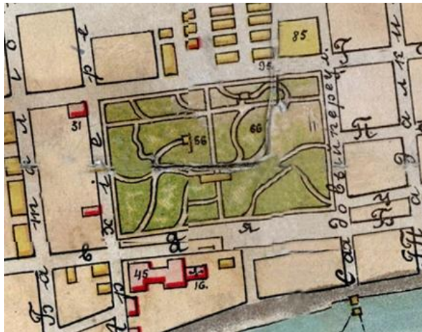
Рис. 3. Фиксационный план Красноярска 1906 г. Фрагмент. Красноярский краеведческий музей.

План Красноярска, составленный в 1906 году, показывает, что в начале двадцатого века по южной границе сада пролегла Садовая улица (ныне улица Богграда), отделившая его от Енисея. Планировка участка сохраняла основные элементы, унаследованные со середины девятнадцатого столетия. Из объектов в саду размещались деревянные постройки летнего общественного собрания и веранды, поставленной на центральной аллее. (Рис. 3)