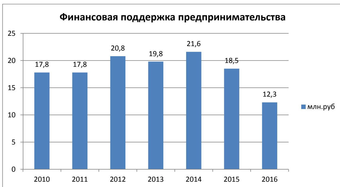
Рисунок 2 - Государственная поддержка МП

В 2013 году объем субсидий несколько снизился по сравнению с 2012 годом, на реализацию ФЦП были предусмотрены следующие средства: 2013г. – 21,84 млрд.руб.; 2014г. - 23,04 млрд.рублей. В конце 2014 г. в связи с кризисом и санкциями Правительством РФ и Президентом РФ было предложено сокращение объема финансовой поддержки на 2014 г до 1,3 млрд. руб. а далее и на 2015г.(рис. 2)