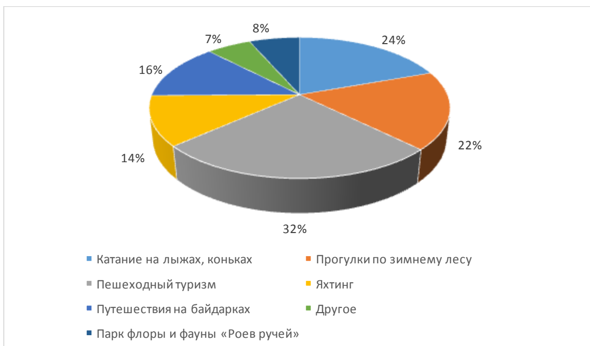
Рисунок 3 - Наиболее интересные виды спорта

Людям нравятся эти места и они хотят заниматься активными видами спорта, что тоже отражено в опросе, так 46% людей ответили, что хотят и любят кататься на лыжах.