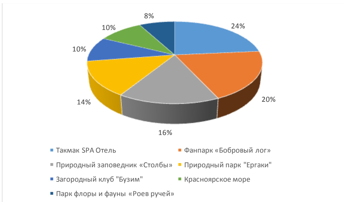
Рисунок 2 – Наиболее привлекательные места для отдыха

Людям нравятся эти места и они хотят заниматься активными видами спорта, что тоже отражено в опросе, так 46% людей ответили, что хотят и любят кататься на лыжах.