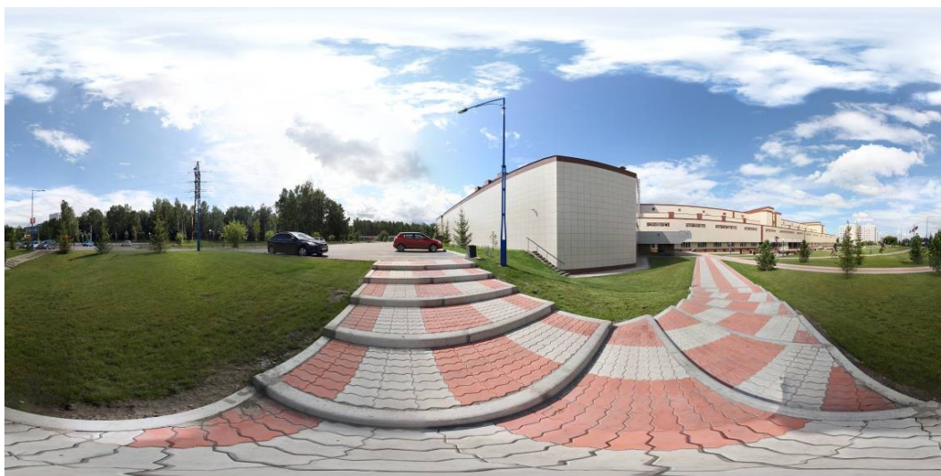
Рисунок 2 – Эквидистантная проекция

При фотосъемке следует использовать специальную панорамную головку, она устанавливается на штатив и имеет смещенный центр. При повороте такая головка чертит окружность вокруг нодальной 18 точки, а объектив фотоаппарата не смещается, находясь на одной вертикальной линии, что способствует более качественному склеиванию полученных фотографий в панораму.