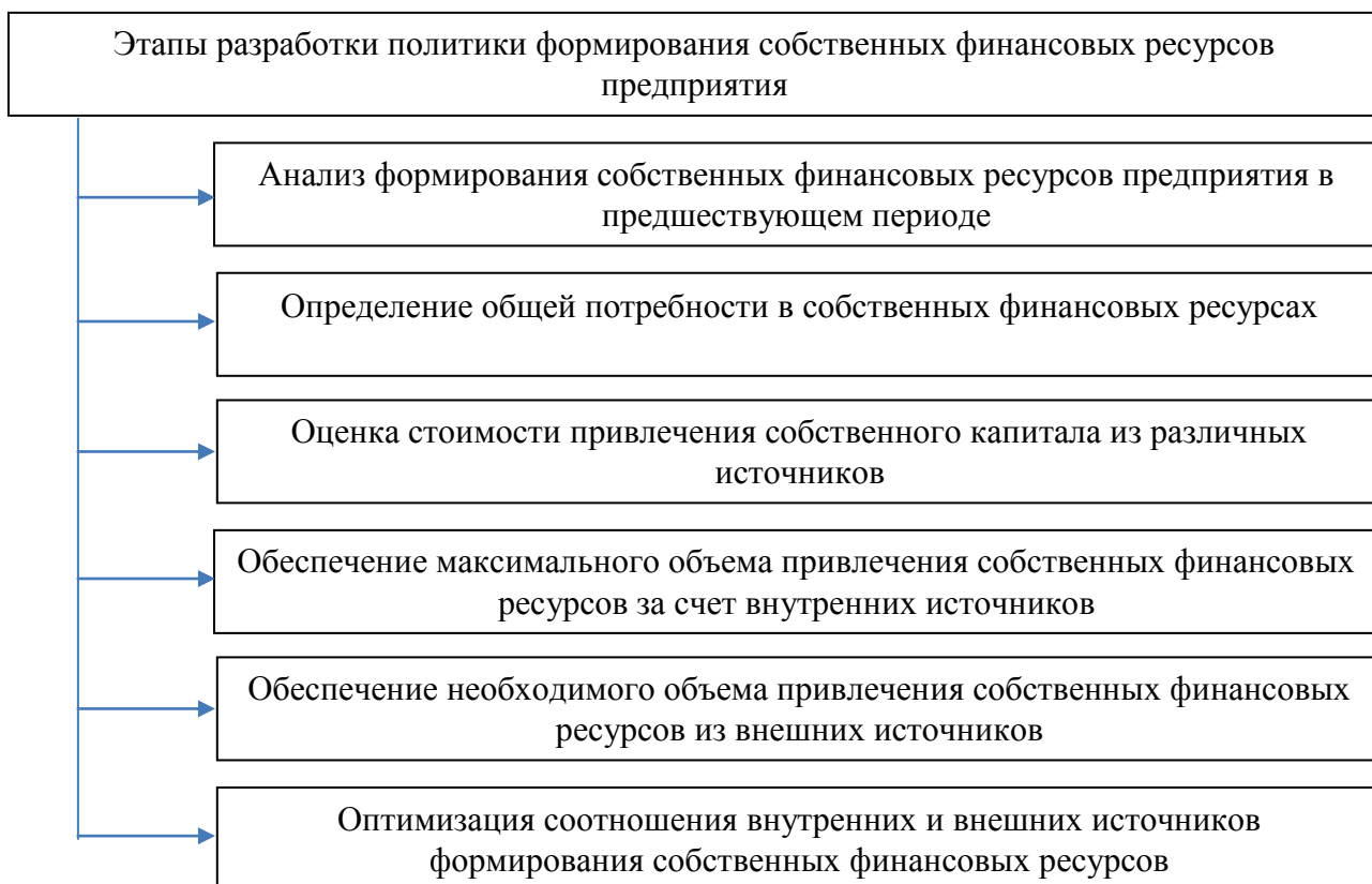
Рисунок 2 – Основные этапы разработки политики формирования собственных финансовых ресурсов предприятия [41]

Разработка политики формирования собственных финансовых ресурсов предприятия осуществляется по следующим основным этапам (рисунок 2).