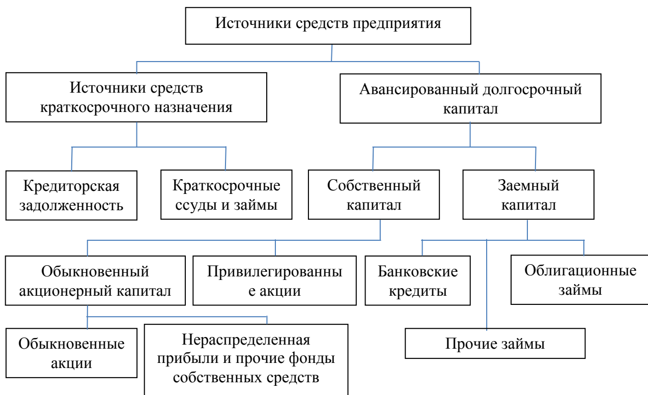
Рисунок 1 - Структура источников средств предприятия [48]

зависимости от их организационно-правовых форм и сферы их деятельности.