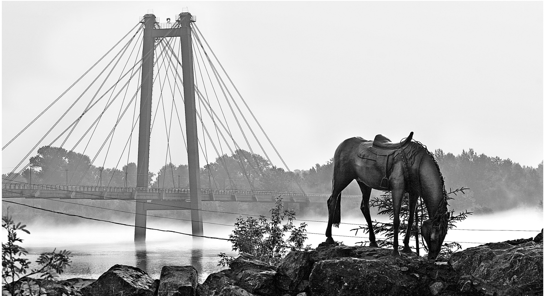
Скульптурная композиция на Стрелке, установленная в честь русских первопроходцев в Сибири

— У нас порядка 200 домов, которые находятся под охраной как памятники культуры. Есть целевая программа до 2012 года по их реставрации, общий объём финансирования — более 900 миллионов рублей