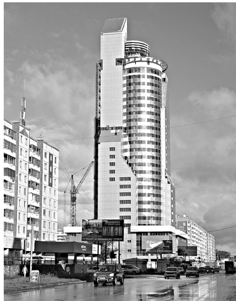
Самое высокое здание в Красноярске 120 метров

вые и без небоскрёбов. Просто — бережное отношение к земле. Там каждый клочок земли используют рационально, находят своё решение, облагораживают.