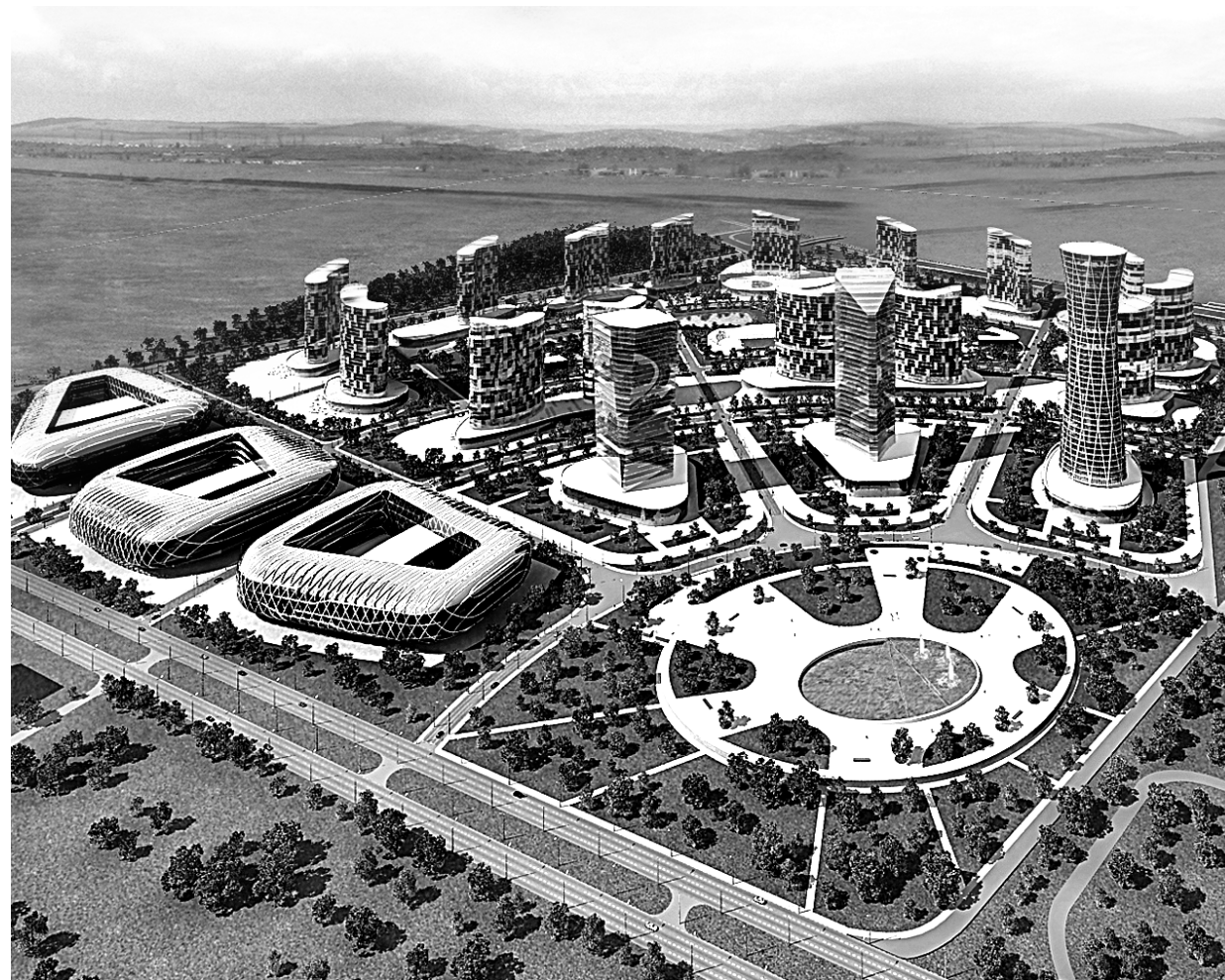
Макет будущего микрорайона Красноярск-Сити