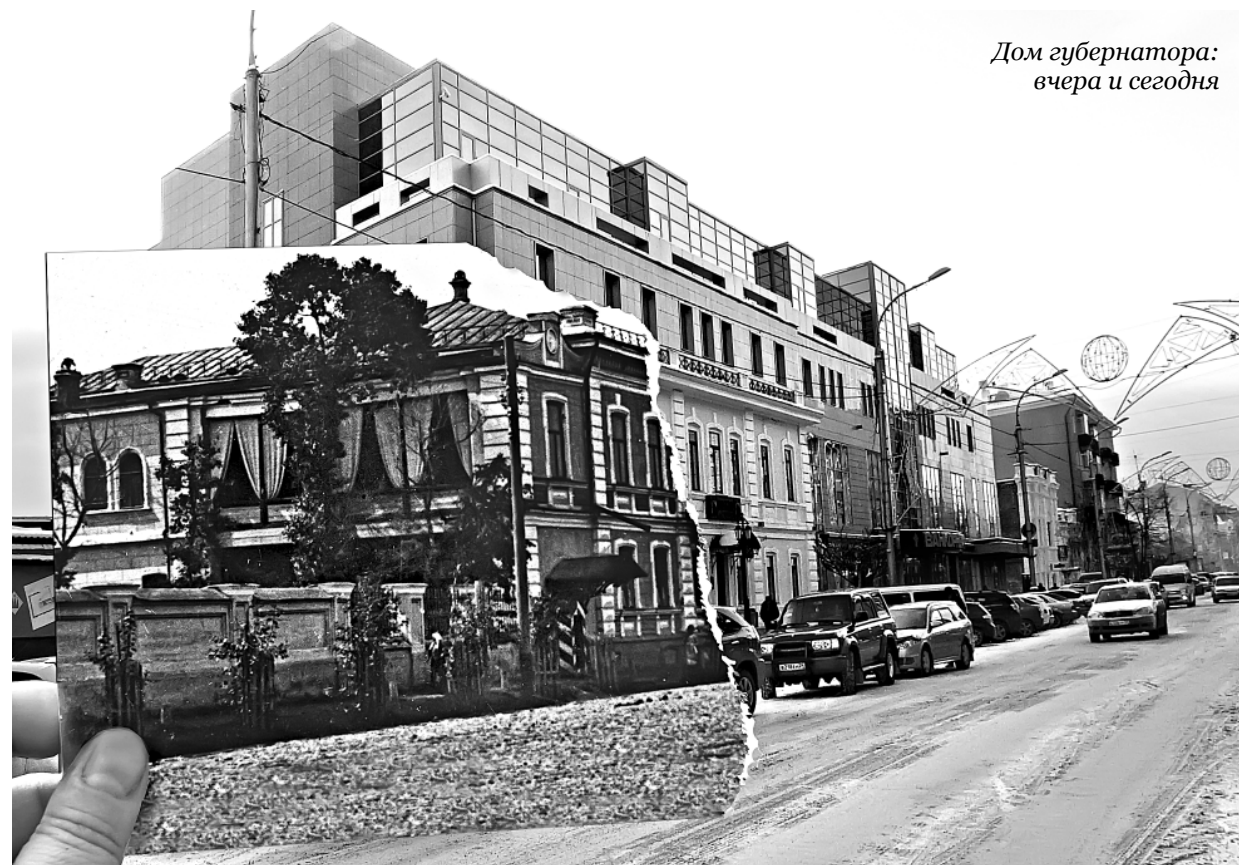
Дом губернатора: вчера и сегодня

— Нам это ни к чему. Всякому видно, что улица длинная и широкая — стало быть, Большая. А вот проулок, здесь стоит церковь Покрова, так его все и зовут — Покровский