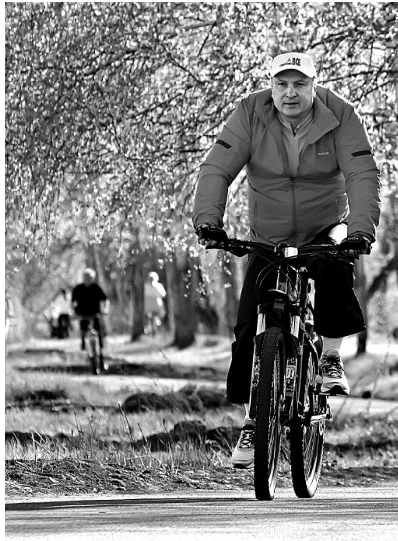
Мэр Красноярск — активный участник «Стартуют все»

— Всё сразу — к сожалению, невозможно, а постепенно — делаем. За последние годы в городе отремонтировано и создано более 2,5 тысяч дворовых детских площадок. Что касается нехватки