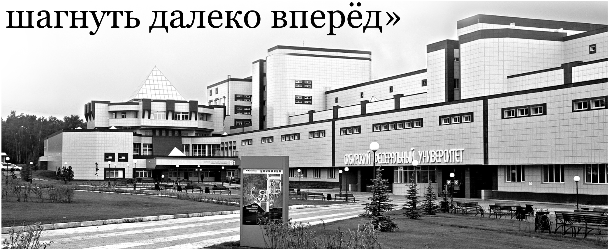
Кампус Сибирского федерального университета — визитная карточка города

из краевого бюджета. Восстановление начнётся уже с этого года. В первую очередь будут отреставрированы Архиерейский дом (Горького, 27), контора Кузнецова (Мира, 24) и дом Севастьянова (Горького, 23). Можно ориентировочно выделить и целый квартал — это дома в районе Карла Маркса, Горького, Декабристов, Богграда. К сожалению, многие из зданий сейчас находятся в ветхом состоянии. Поэтому людей из них будем переселять, дома реставрировать и находить им новое применение — как культурным и социальным учреждениям. Думаю, это вдохнёт новую жизнь в исторический центр.