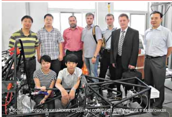
У болида, который китайские студенты собирают для участия в автогонках

туры, защитившие диссертации и ставшие докторами PhD, не могут сразу работать преподавателями в родном вузе. Они должны поработать на производстве либо в провинциальных университетах, обязательно пройти стажировки в ведущих университетах мира и только после этого могут участвовать в конкурсе.