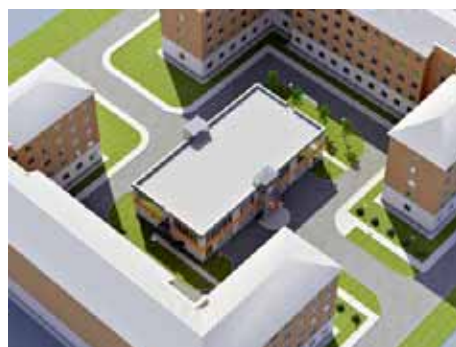
Вверху — проект нового учебно-лабораторного корпуса.