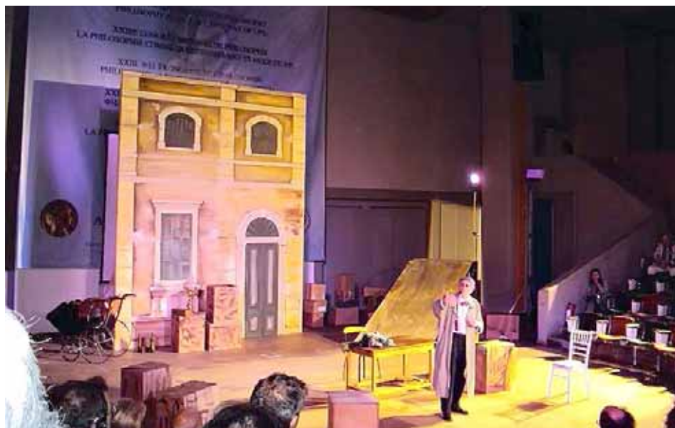
Вечерний спектакль «Шопенгауэр» в зале пленарных заседаний Афинского национального университета

В этом ответе — всё высокомерие представителей англосаксонской философии по отношению к представителям нашей отечественной философии. Американцы не читают и не знают наших авторов. У нас, на-