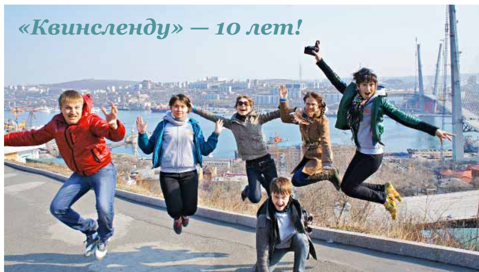
«Квинсленду» — 10 лет!