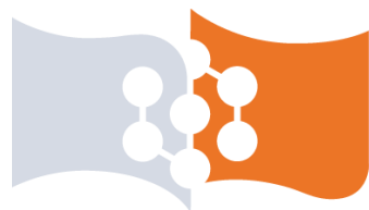
Рисунок 9 – Знак, логотип

СИБИРСКИЙ ФЕДЕРАЛЬНЫЙ УНИВЕРСИТЕТ SIBERIAN FEDERAL UNIVERSITY