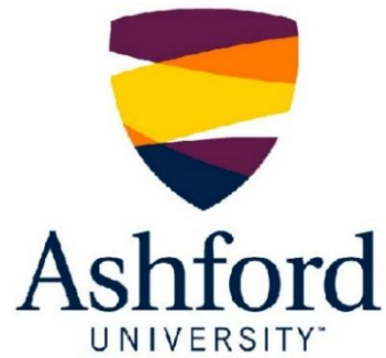
Рисунок 2 - Ashford University (United States)