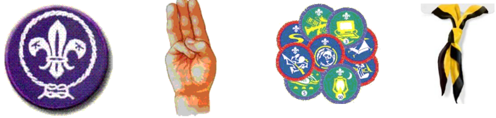
Рисунок 1 – Скаутские атрибуты и символы

С самого начала скаутское движение было открыто для всех мальчиков, какого бы социального происхождения они ни были, кем бы они ни были рождены и к какой бы религии они ни принадлежали. И, действительно, те, кто принимал участие в экспериментальном лагере на острове Браунси, специально подбирались из различных социальных слоев. Несмотря на то, что скаутское движение начиналось в Великобритании, оно тут же прижилось далеко за ее пределами в странах с совершенно другой культурой и социально-экономическими условиями. И, наконец, несмотря на то, что движение началось в христианской среде, оно без особых трудностей обосновалось в индусской, буддистской, мусульманской и другой религиозной среде. Сегодня как движение для «молодых людей» оно открыто для всех: мальчиков и девочек, юношей и девушек, вне зависимости от происхождения, расовой принадлежности, убеждений или ограничений, связанных с полом.