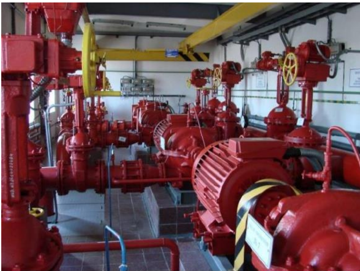
Рисунок 2.1- пожарные насосы 1Д-500-63

В соответствии с НПБ 88-2001[12] п. 4.73: