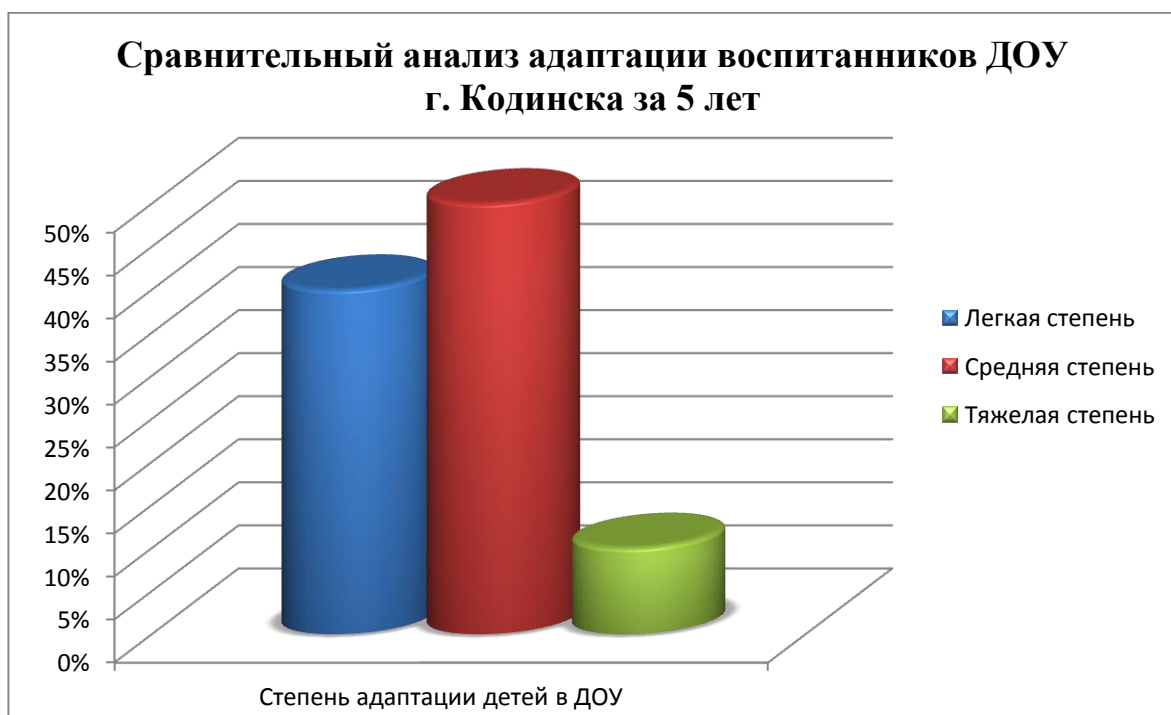
Рисунок 2 — Результаты анализа степени адаптации детей к условиям ДОО

Сравнительный анализ адаптации воспитанников ДОО за пять лет свидетельствует об устойчивости преобладания средней степени адаптации детей – 50%. Вместе с тем 40% воспитанников имеют легкую степень адаптации, а 10% – тяжелую степень. Результаты исследования представлены на рисунке 2: