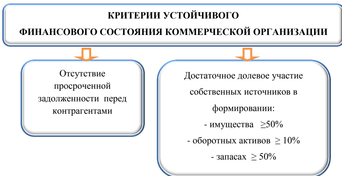
Рисунок 1.2 – Критерии устойчивого финансового состояния коммерческой организации

Неустойчивое финансовое состояние формируется в результате перманентной убыточности деятельности организации или использования дивидендной политики, предполагающей отсутствие возможности использования нераспределенной прибыли на реинвестирование в бизнес для его развития. Основным критерием неустойчивого финансового состояния является наличие просроченной задолженности по своим обязательствам. Однако при этом, величина просроченных обязательств не должна превышать сумму в 300 тыс. руб. Если этот лимит превышает, то такую организацию следует де факто отнести в разряд потенциальных банкротов и признать ее финансовое состояние критическим.