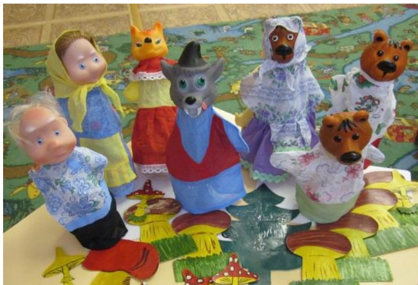
Театр би ба бо