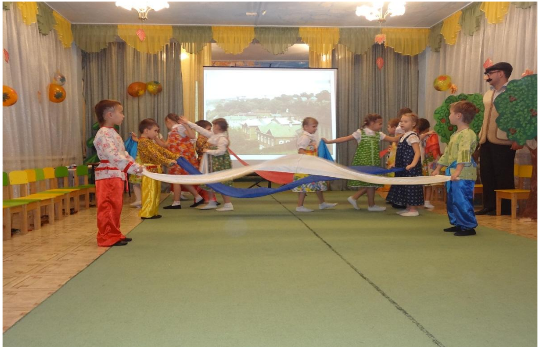
Музыкальный спектакль «Наша Родина Россия»