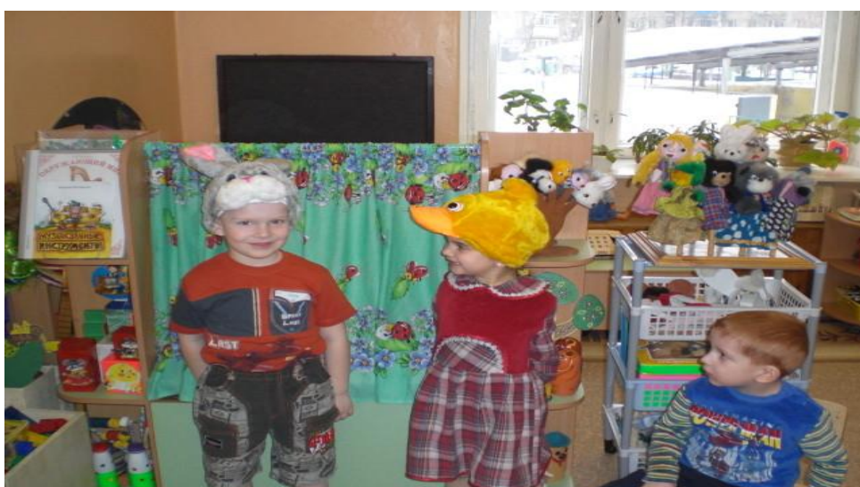
Инсценировка сказки «Лиса и Заяц»