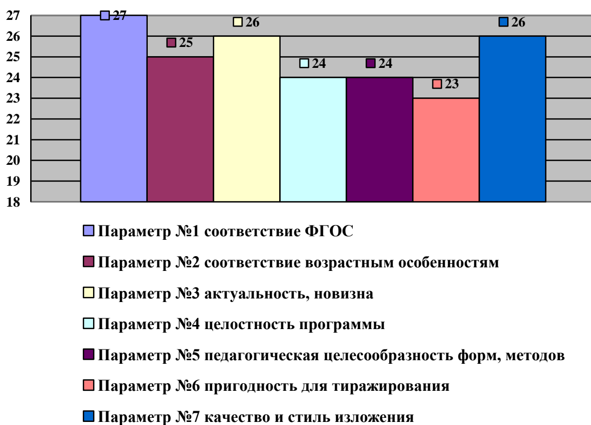
Рисунок 2 – соотношение уровней суммы баллов по каждому из параметров экспертной оценки

выше указанных структурных компонентов с ними. Следует отметить, что большого разрыва между суммированными оценками параметров не существует, это свидетельствует о целостности и качестве разработанной программы, её обоснованности и учёте ряда основополагающих требований при разработке программы. (Рисунок 2) Максимально возможная сумма баллов по всем параметрам от всех экспертов – 27 баллов. Минимально возможная сумма баллов (при учёте минимальной оценки экспертов в 2 балла, что следует из Таблицы 1) – 18 баллов.