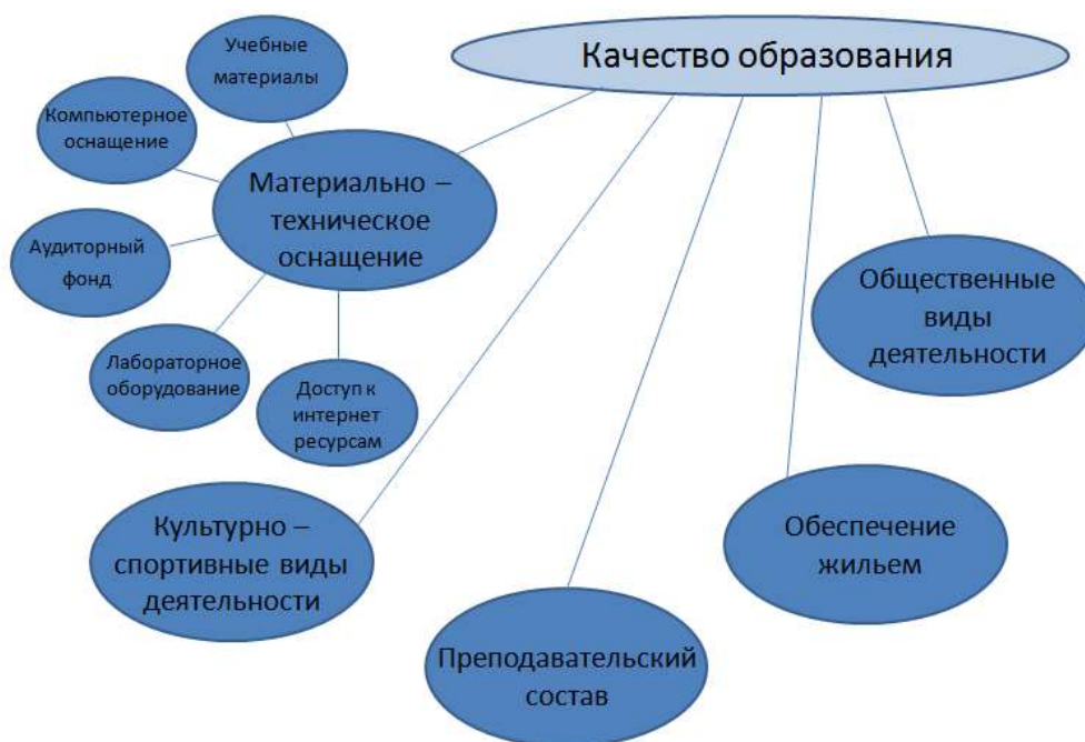
Рисунок 2 - Составляющие качественного образования

Из приведенного выше анализа теперь можно выделить, из каких составляющих складывается качественное образование. Данные составляющие качества образования представлены на рисунке 2.