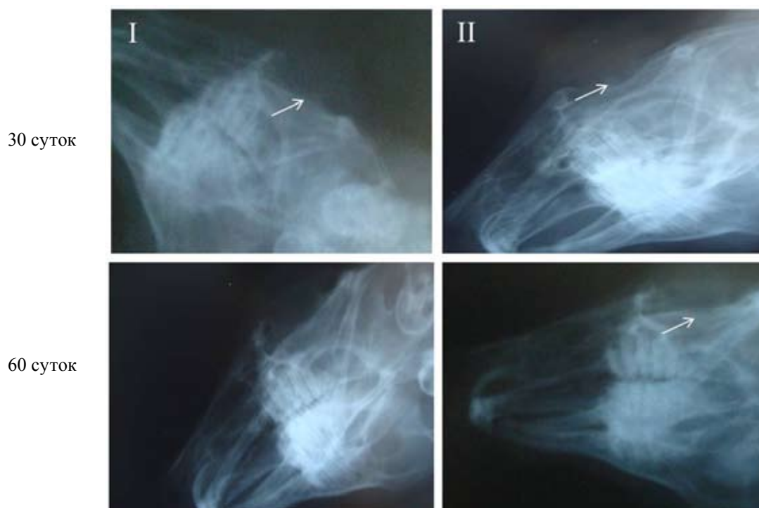
Рис. 2. Данные рентгенологических исследований восстановления модельного дефекта нижней стенки орбиты у кроликов: I – 3D-пластина из П(ЗГБ); II – аллохрящ (контрольная группа). Стрелками показана область имплантации

На 30-е сутки в контрольной группе животных на рентгенограмме черепа просматривались округлые контуры аллохряща (рис. 2). Надкостница при этом изменялась слабо, что, возможно, было вызвано длительным временем приживания имплантата и адаптацией к нему окружающих тканей. В эти же сроки после имплантации 3D-пластины из П(ЗГБ) надкостница не изменялась, на рентгенограммах была видна неровность внутренней поверхности глазницы у вершины, возможно, за счет изоляции костного дефекта от мягкой соединительной ткани имплантатом, выпол-