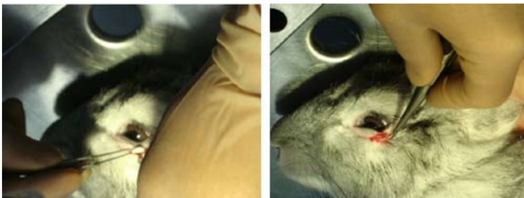
Рис. 1. Пластика дефекта нижней стенки орбиты кролика имплантатом из П(ЗГБ)

животных (состояние тканей в операционной зоне, подвижность глазного яблока, послеоперационные отеки и гиперемия тканей). Рентгенологическое исследование опытных животных выполняли на рентгенологическом аппарате РУМ-20 в режиме 44 мА 0.1 кВ с экспозицией в 1 с. Оценивали размеры костного дефекта, его форму, однородность структуры костного регенерата. Морфологические исследования выполнены общепринятыми методами. После декальцинации препаратов раствором «Трилон-Б» готовили гистологические срезы (толщиной 5-10 мкм), которые окрашивали гематоксилин-эозином. На аутопсии оценивали состояние окружающих мягких тканей, состояние костной ткани.