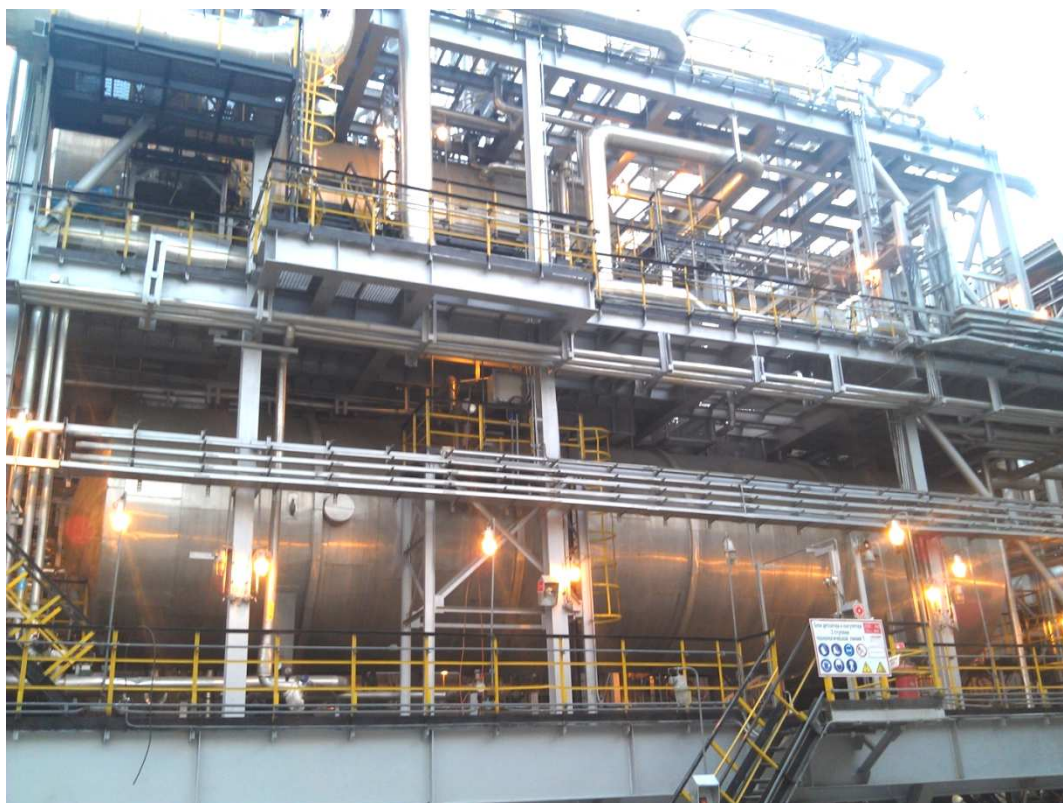
Рис. 1 – аппарат для подготовки нефти.

В данной статье рассмотрен один из вариантов изменения технологического процесса подготовки нефти (стандартной схемы). Особенностью реконструкции является, что ее реализация существенно повышает показатели установки подготовки нефти (УПН) (рис. 1) не требуя капитальных затрат.