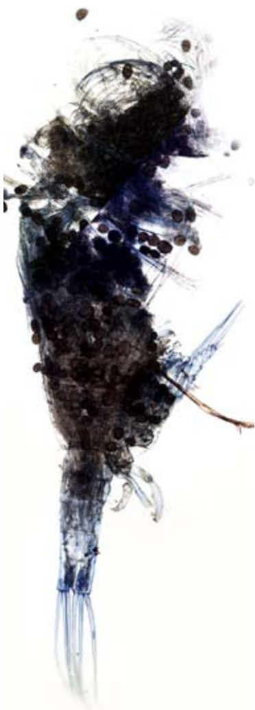
Рис. 3. Heterocope appendiculata из оз. Большой Харбей, июль 2012 г.

нию воды озер прогревались в профундали в равной степени от поверхностных слоев до дна (Батурина и др., 2012). Вместе с тем интенсивное ветровое перемешивание способствовало взмучиванию донных осадков, вследствие чего наряду с «цветением» воды в озере наблюдали небольшую прозрачность воды, что в условиях арктических широт оказывало благоприятное воздействие на развитие зоопланктона за счет поглощения ультрафиолетового света (Rautio, Korhola, 2002).