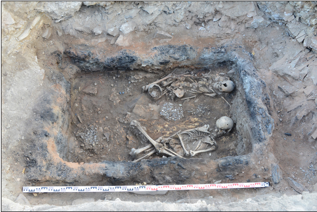
Рис. 2. Погребение 2/2021. Оглахтинский грунтовый могильник. Снято с севера Fig. 2. Burial 2/2021. Oglakhtinsky ground burial ground. Taken from the north