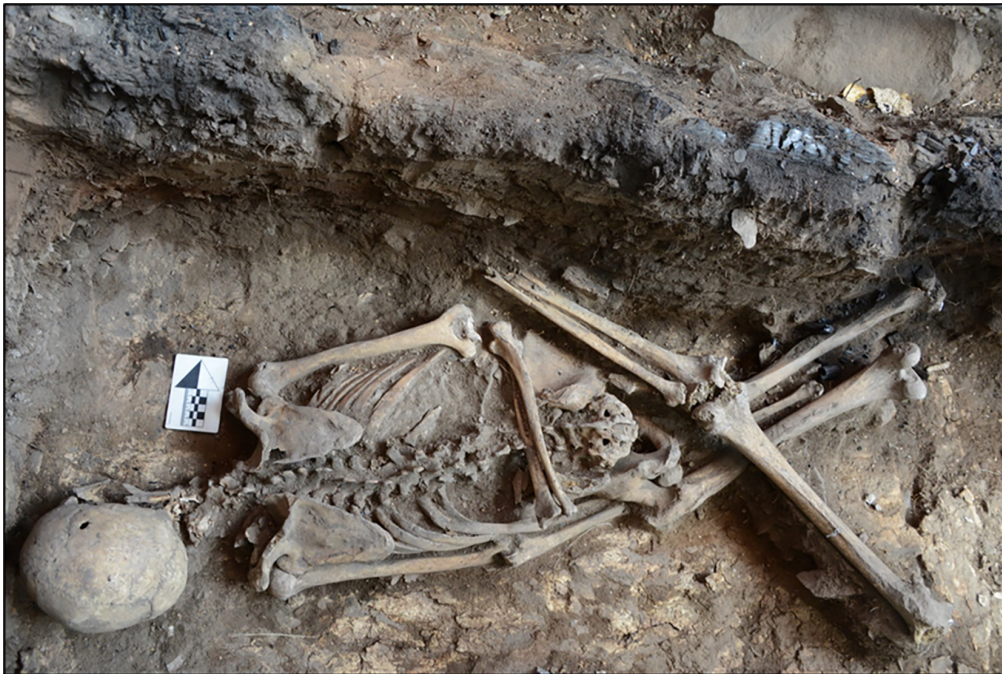
Рис. 3. Погребение 2/2021. Скелет 1. Оглахтинский грунтовый могильник. Снято с юга Fig. 3. Burial 2/2021. Skeleton 1. Oglakhtinsky ground burial ground. Taken from the south