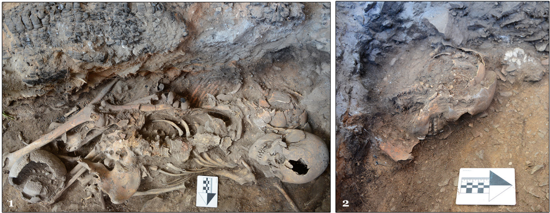
Рис. 4. Погребение 2/2021. Оглахтинский грунтовый могильник: 1 — положение скелетов 2 и 3; 2 — положение черепа скелета 3