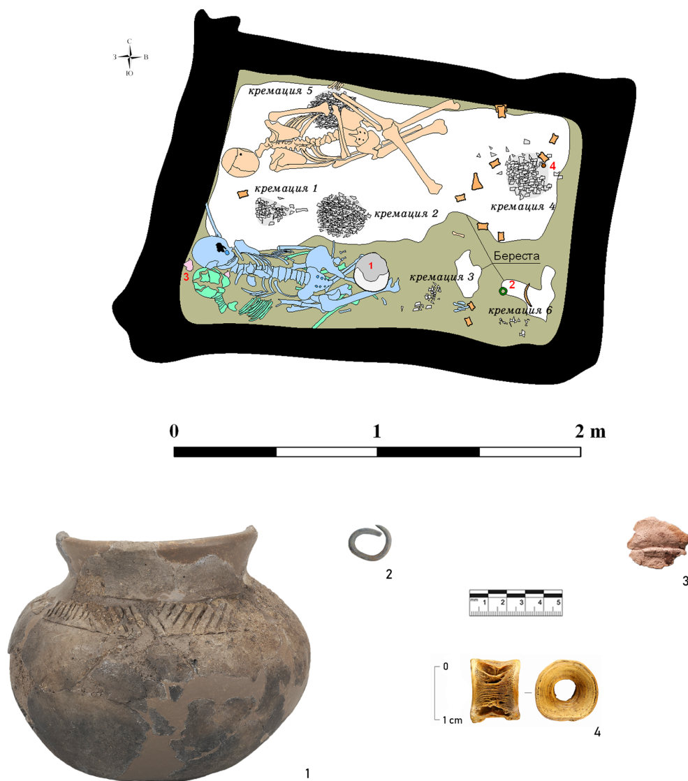
Рис. 1. План и инвентарь погребения 2/2021. Оглахтинский могильник Fig. 1. Burial plan and inventory 2/2021. Oglakhtinsky burial ground

О. В. Зайцева, И. Г. Широбоков, Е. В. Водясов, Е. Н. Учанева, А. К. Каспаров