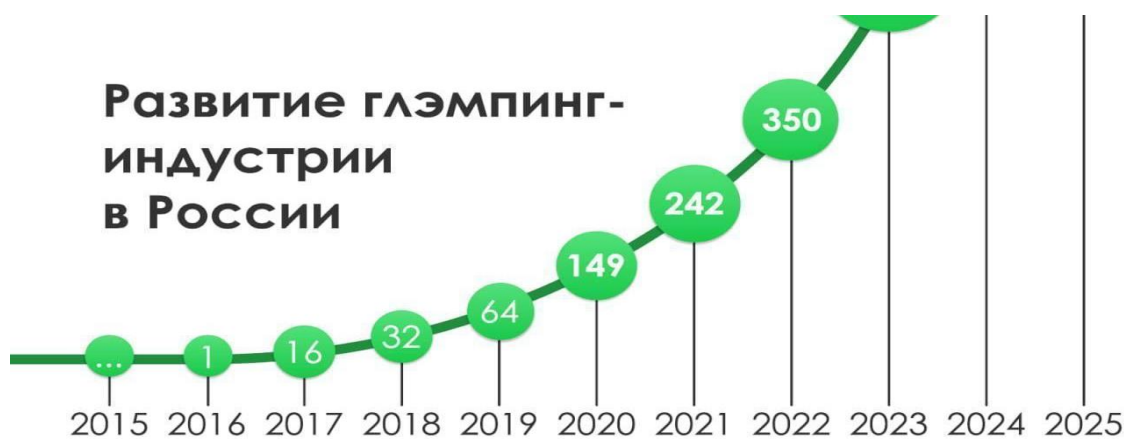
Рисунок 3 – Динамика роста количества глэмпингов по РФ

с 8 палатками-шатрами, зоной отдыха, охраной и ресепшен расположились на крыше открытой парковки торгового центра «Авиапарк». Цель проекта Moscow Escape – дать жителям столицы возможность отдохнуть, не выезжая из города [20].