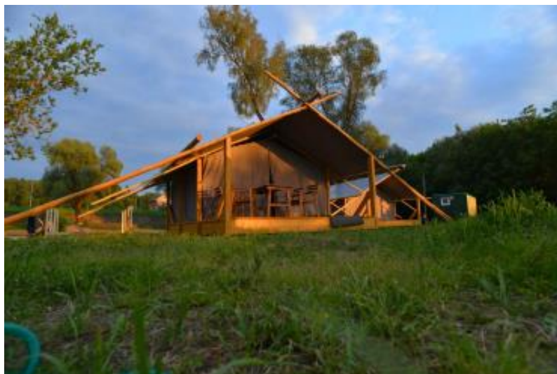
Рисунок 1 – Глэмпинг «Гуляй-город»

По состоянию на начало июня 2023 года в России функционировало 416 глэмпингов. Эти объекты размещены преимущественно на территориях с развитой инфраструктурой вблизи крупных городов.