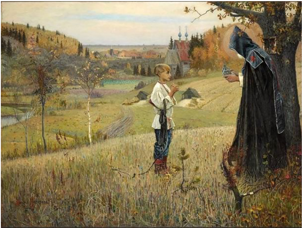
Рис. 3. М.В. Нестеров. Явление отроку Варфоломею. 1890. Х., м. 160 x 211. ГТГ.