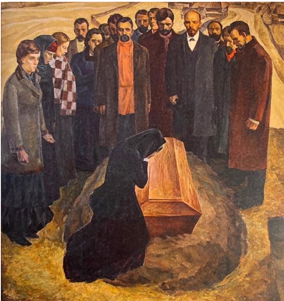
Рис. 2. С.Е. Орлов. Похороны А.А. Ванеева. Х., м. 196 x 186. Красноярский художественный музей имени В.И. Сурикова.