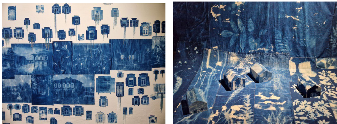
Рис. 2 а,б. Инсталляция «Заливные луга». Анастасия Безвершук.