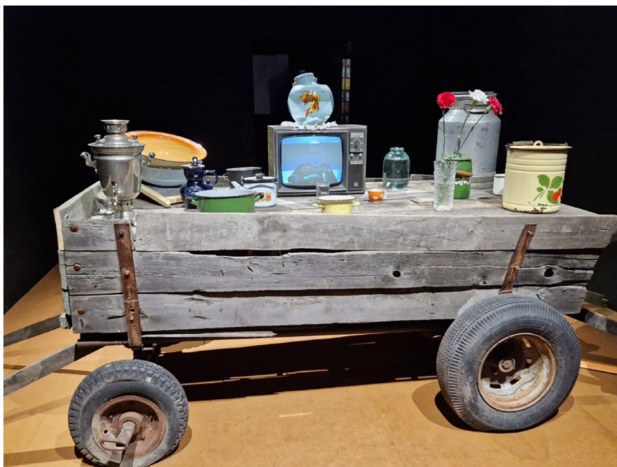
Рис. 3. Инсталляция «Память воды». Гриша Шаров.