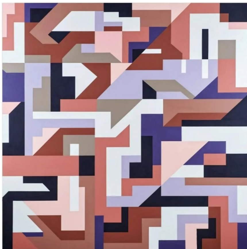
Рис. 3. Аверин Ю.В. Токио, 2022. Холст, акрил. 150x150. Собственность автора Fig. 3. Averin Yu.V. Tokyo, 2022. Canvas, acrylic. 150x150. The property of the author