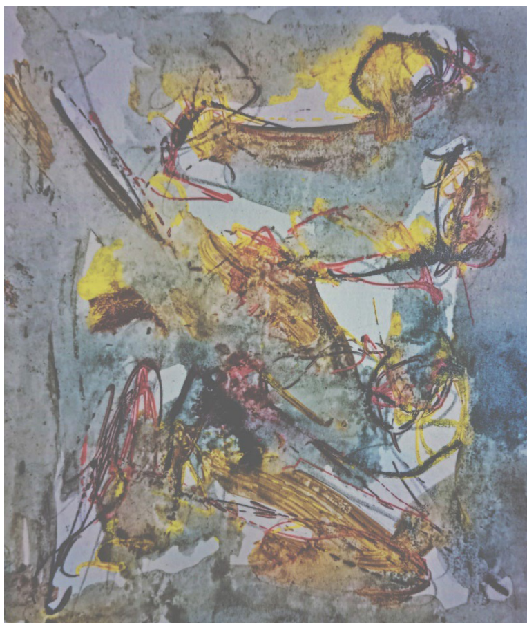
Рис. 1. Makeev A. С. Пролетающие во времени. 2023. Холст, акрил. 160x135. Собственность автора