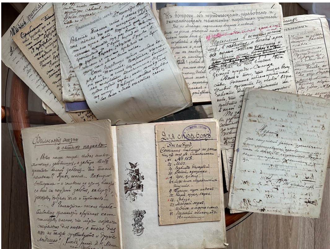
Рис. 1. Fig. 1.