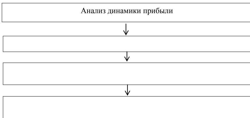
Рисунок 1.2 – Задача анализа формирования и использования прибыли [6]

Задачи анализа формирования и использования прибыли представлены на рисунке 1.2.