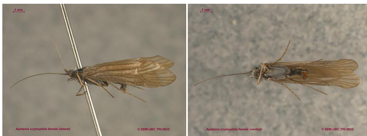
Рисунок 1 – Имаго A. crymophila (самка, латеральный и вентральный вид) [23].

Строение тела и внешний вид. Имаго A. crymophila – серые или серовато-бурые бабочки (Рис. 1.), длина их тела, не считая нитевидных усиков, колеблется в пределах 1-2 см. Имеют две пары продолговатых тонких мягких крыльев, покрытых «волосками», которые складывают в покое на спинке под острым углом. Полёт медленный, хаотичный. В течение дня имаго летают над поверхностью воды или сидят на прибрежных камнях, растениях.