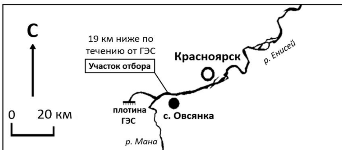
Рисунок 4 – Участок отбора проб водного мха [12].

Отбор водного мха, на котором находились агрегации ручейников, проводился вблизи левого берега реки, напротив с. Овсянка, рядом с одноимённым островом ( 55^{\circ}58'06'' с. ш., 92^{\circ}33'32'' в. д.), в период с июня по ноябрь 2022 года (Рис. 4.).