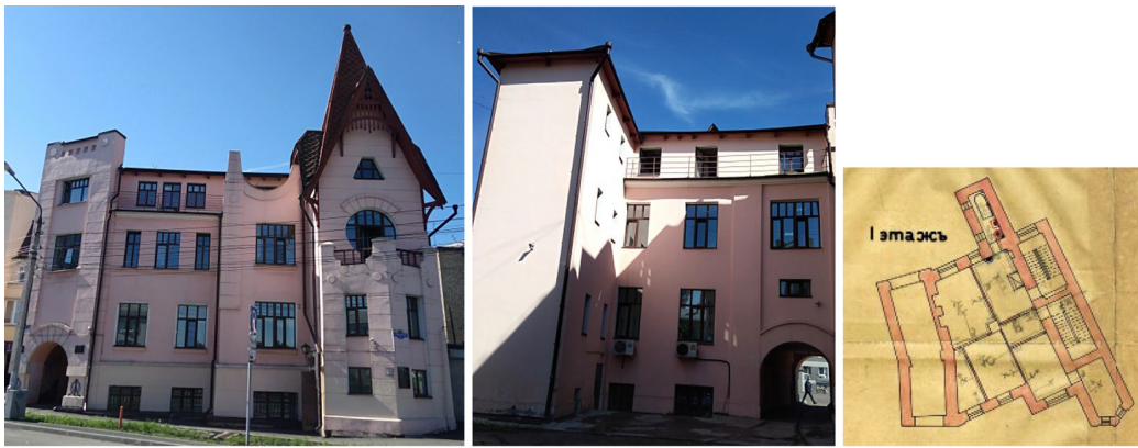
Рис. 3. Особняк Л.А. Чернышёва в Красноярске: лицевой и внутренний фасады и план (Куклинский, 2019: 100)