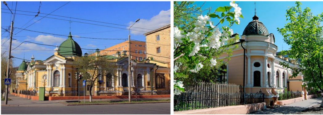
Рис. 1. В. А. Соколовский. Особняк В. Н. Гадаловой. 1909–1913. Внешний вид Fig. 1. V.A. Sokolovsky. Mansion V.N. Gadalova. 1909–1913. Appearance

Италии. Для оформления стен В. А. Соколовский использует лепнину, ниши и портики с парными полуколоннами. Также на фасаде можно заметить отделку рустом, отсылающую нас к палаццо времён Ренессанса.