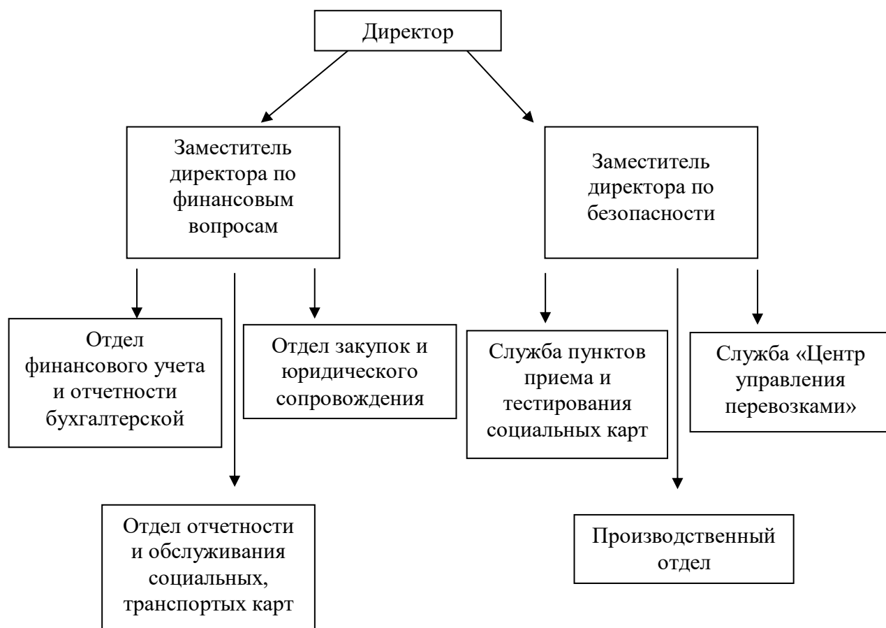
Рисунок 1 – Укрупненная схема организационной структуры управления ГПКК «Красноярскавтотранс»

Кроме того, 100% доли ООО «Краевой центр коммуникаций» в уставном капитале принадлежит ГПКК «Красноярскавтотранс».