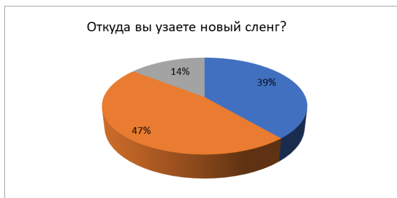
Рисунок 3 – Откуда вы узнаете новый сленг?

Последний вопрос был: «Откуда вы узнаете новый сленг?». 47% опрошенных ответили, что случайно услышали от знакомых; 39% – встретили сленг в социальных сетях; и 14%, что в газетах, журналах и на телевидении (Рис. 3).