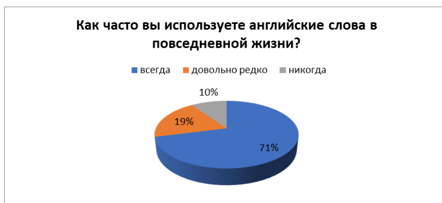
Рисунок 2 – Как часто вы используете английские слова в повседневной жизни?

Последний вопрос был: «Откуда вы узнаете новый сленг?». 47% опрошенных ответили, что случайно услышали от знакомых; 39% – встретили сленг в социальных сетях; и 14%, что в газетах, журналах и на телевидении (Рис. 3).