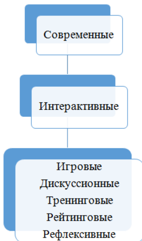
Рисунок 2 – Классификация образовательных технологий