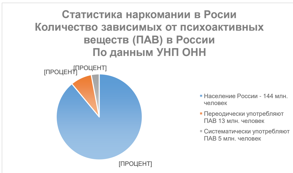
Рисунок 2 – Статистика наркозависимых от психоактивных веществ в России.

становится больше (рис. 2). Их воздействие на организм оценивается как крайне агрессивное. Многие соли ведут к необратимым процессам в работе головного мозга и привыканию уже после первого применения. Причиной смерти в результате употребления синтетических препаратов, в большинстве случаев, является истощение и некроз внутренних органов.