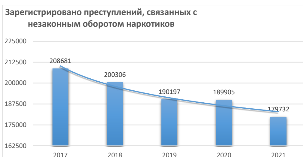
Рисунок 1 – Зарегистрированные преступления в сфере незаконного оборота наркотиков в России.

Статистика нарушений законодательства о наркотиках дает представление о соблюдении законодательства о противодействии распространения наркотиков. Эти показатели зависят от работы правоохранительных органов и, следовательно, от обстоятельств, влияющих на их работу, а также от практики регистрации и отчетности. Несмотря на то, что количество зарегистрированных наркопреступлений, начиная с 2017 года, уменьшилось, уровень остается достаточно высоким 8 (рис. 1).