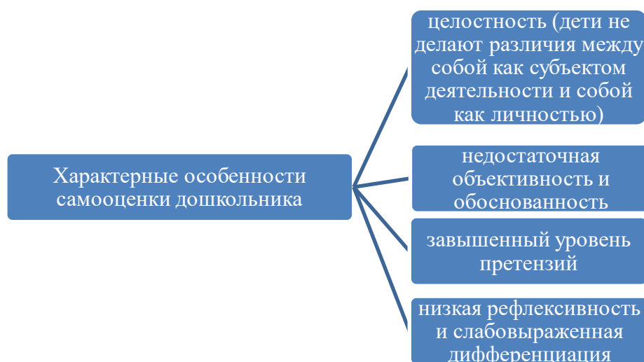
Рисунок 2 – Характерные особенности самооценки дошкольника [48]

Самой адекватной индивидуальной самооценкой в дошкольном возрасте, в сравнении с реалистической самооценкой, которая характерна для взрослых людей, обычно является завышенной.