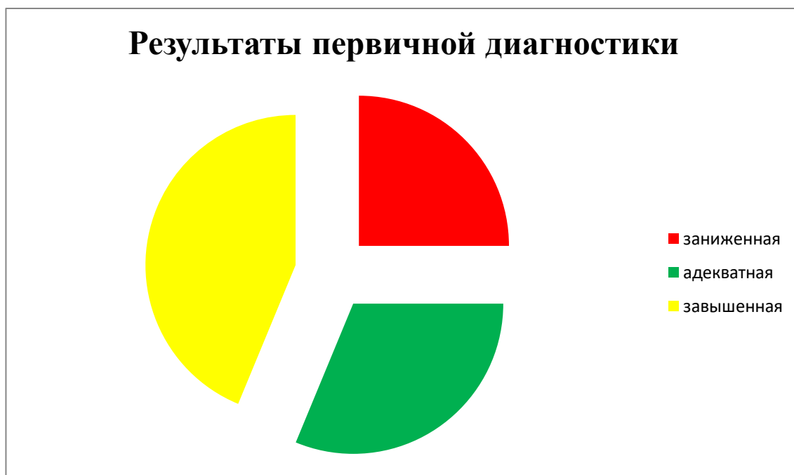
Рисунок 3 – Результаты первичной диагностики

Далее мы сопоставили данные всех трех методик и составили сводную таблицу, которая находится в приложении данного выпускного исследования.