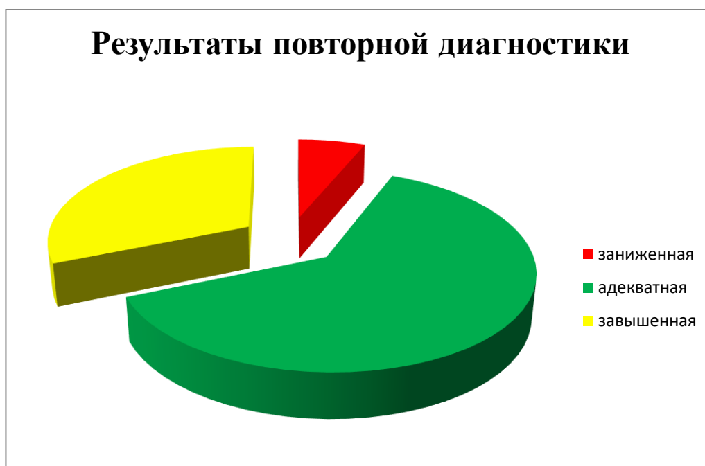
Рисунок 4 – Результаты повторной диагностики

Таким образом, разработанные нами методические рекомендации по формированию самооценки у детей старшего дошкольного возраста в ходе сюжетно-ролевой игры, показали свою эффективность: трое дошкольников перешли с низкого уровня самооценки, то есть с заниженной – на адекватный, и хочется отметить, что те дети, которые не перешли на другой уровень по среднему показателю, тоже имеют динамику в баллах, что позволило нам убедиться в эффективности проделанной нами работы, также один ребенок с завышенной самооценкой стал иметь адекватный показатель сформированности, дети, которые на констатирующем этапе показали адекватную самооценку, все остались на этом уровне, и мы убеждены, что если и дальше проводить сюжетно-ролевые игры, направленные на повышение самооценки, то динамика показателей продолжится.