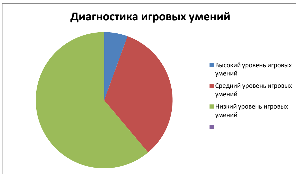
Рисунок – Диагностика игровых умений

Мы считаем, что формировать у дошкольников игровые умения целесообразно через включение их в разные виды игр.