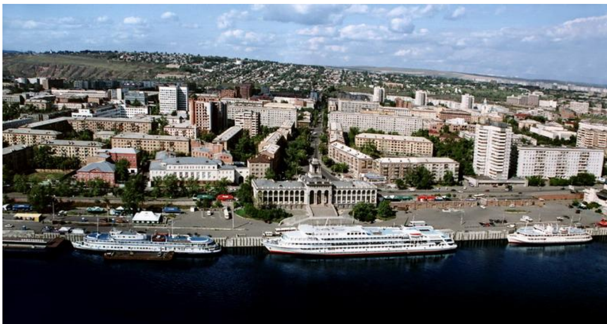
Рисунок В.2 – Здание речного вокзала в пространстве г. Красноярск