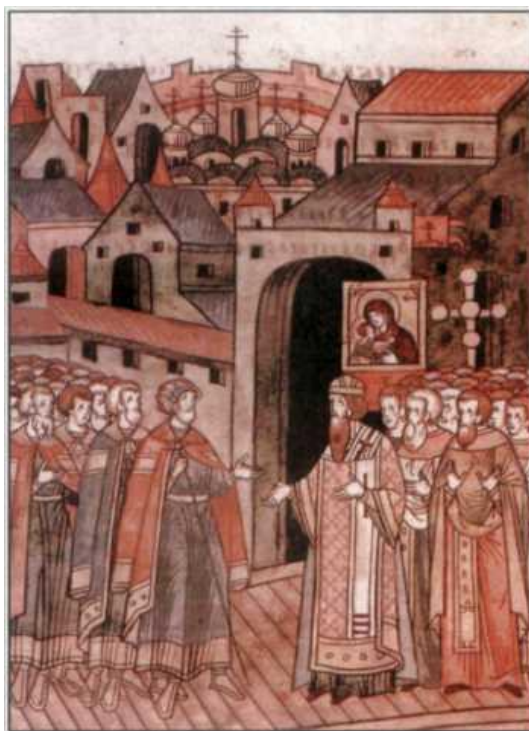
Рисунок А.4 – Миниатюра Лицевого летописного свода. XVI век. Встреча Дмитрия Донского в Москве по возвращении из похода.