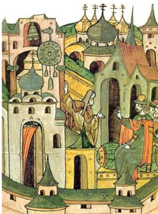
Рисунок А.5 – Миниатюра Лицевого летописного свода. XVI век. Установка в 1404 г. афонским монахом Лазарем Сербом «часомерья» на великокняжеском дворе за Благовещенским храмом.