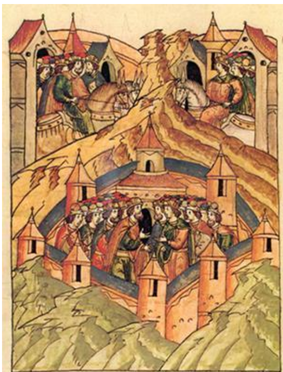
Рисунок А.1 – Миниатюра Лицевого летописного свода. XVI век. Встреча суздальского князя Юрия Долгорукого с князем Святославом 4 апреля 1147 года в Москве.