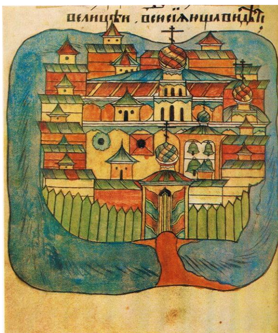
Рисунок А.6 – Монастырский ансамбль XVII века. Миниатюра из «Жития Антония Сийского» 1648 года. Бумага, темпера. Собрание Щукина, № 750, л. 168 об.