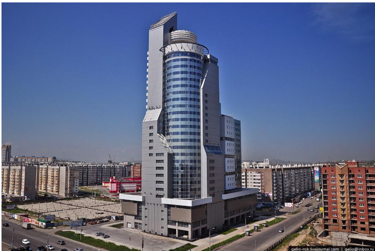
Рисунок Г.1 – Торгово-деловой центр «Первая башня»