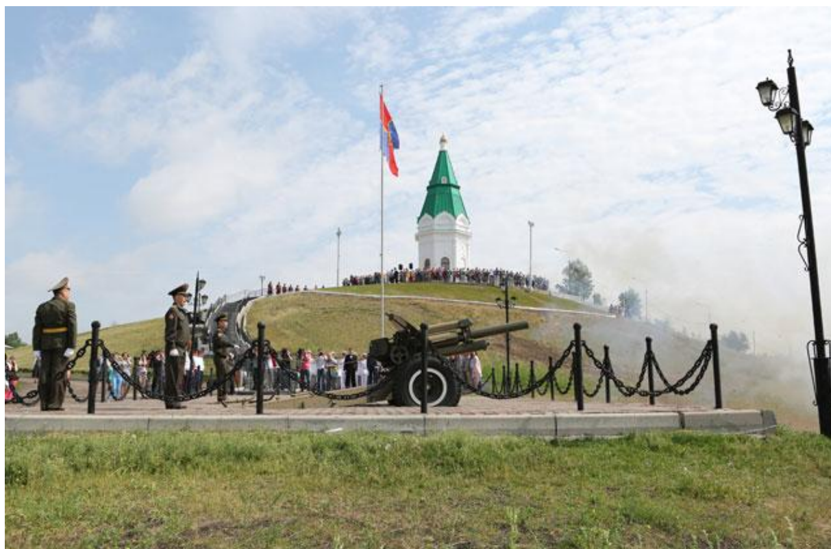
Рисунок Б.5 – Современный облик часовни Параскевы Пятницы