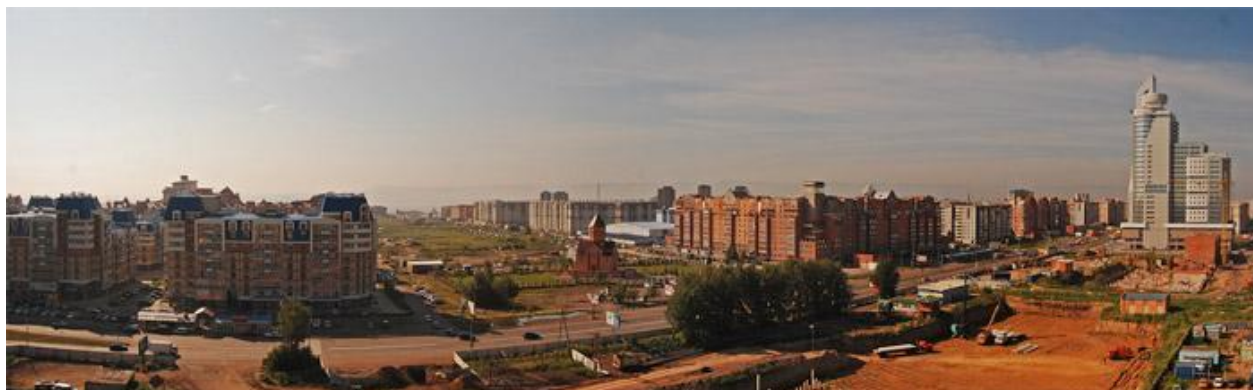
Рисунок Г.2 – Торгово-деловой центр «Первая башня» в пространстве г. Красноярска