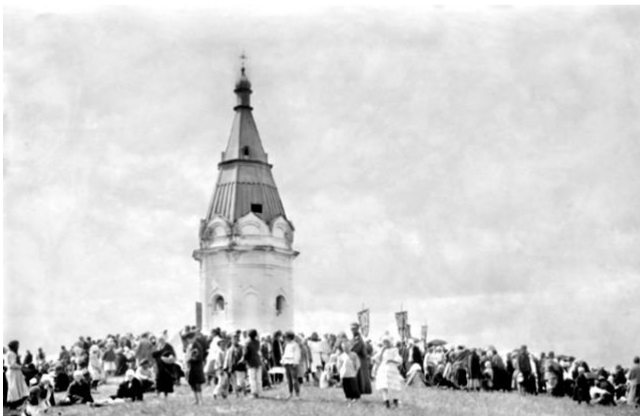
Рисунок Б.1 – Часовня на Караульной горе