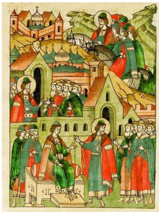
Рисунок А.3 – Миниатюра Лицевого летописного свода. XVI век. Св. вел. кн. Александр Невский сажает Димитрия наместником в Новгороде.