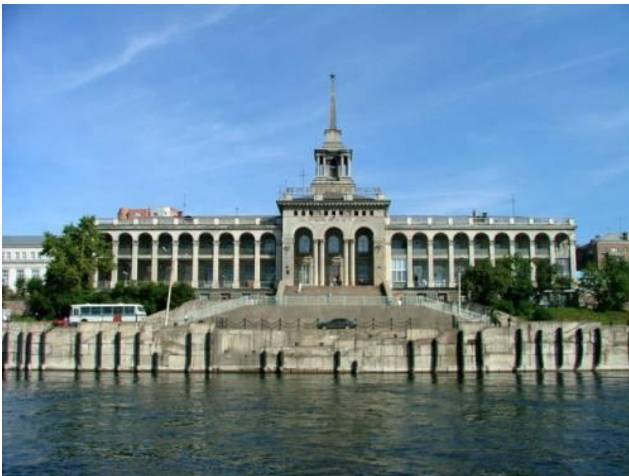
Рисунок В.1 – Здание речного вокзала