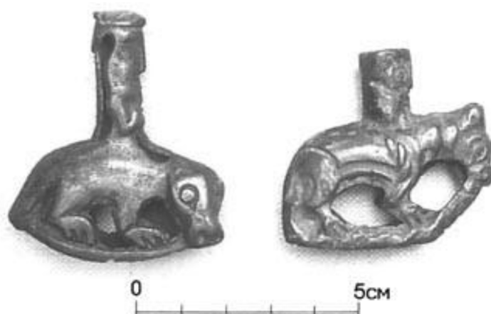
Рис. 3. Фигурки-подвески с композициями «всадник на звере», найденные в погребениях Сайгатинского I могильника (X–XII вв., Западная Сибирь)

Левую часть композиции составляют предположительно два антропоморфных