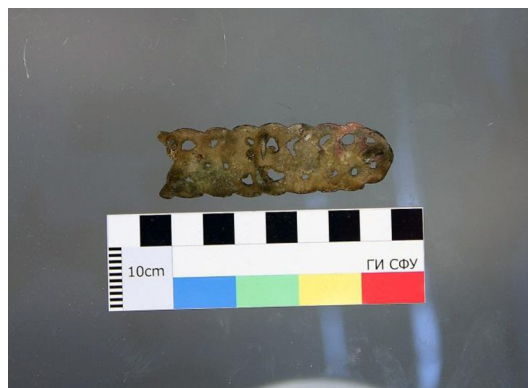
Рис. 2. Ажурный наконечник ремня (вид сзади) Fig. 2. Openwork belt tip