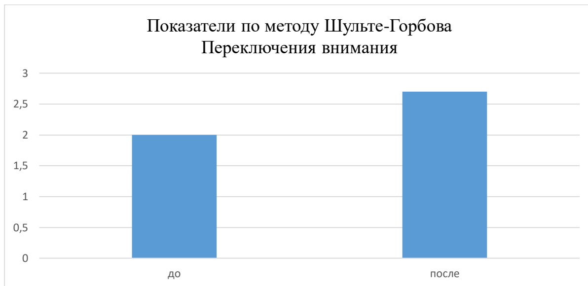
Рисунок 1 – Сравнение показателей переключаемости внимания до коррекционных занятий и после

По методу Шульте-Горбова дети показали заметный рост переключаемости внимания. Если в первичном исследовании средний показатель был равен 2,0, то после коррекционных занятий он увеличился до 2,7, графическое представление сравнения в рисунке 1. Индивидуальные результаты можно увидеть в таблице 4.