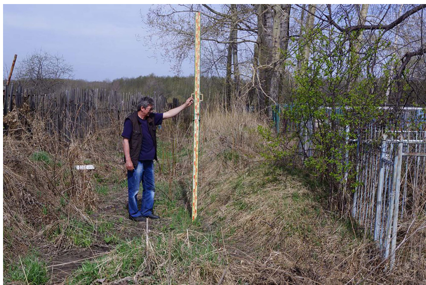
Рис. 3. Участок западных рва и вала острога (снято с ЮВ) Fig. 3. Section of the western moat and rampart of the «ostrog» (filmed from SE)