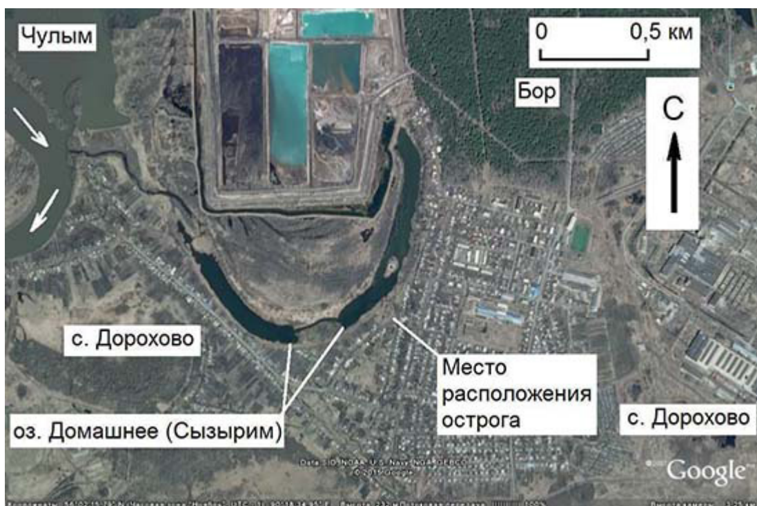
Рис. 2. Озеро Домашнее, бывшее Сызырим