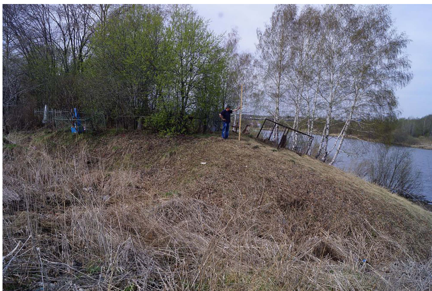
Рис. 4. Восточный ров (овраг?) (снято с СВ) Fig. 4. East moat (ravine?) (filmed from NE)

водоема, на самом возвышенном месте во избежание затопления во время наводнений, с учетом использования фортификационных особенностей местности (крутого берега или оврага). Поблизости от места строительства острога должен быть строительный