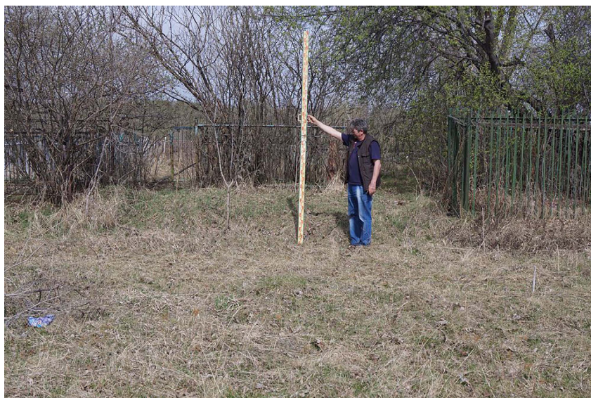
Рис. 5. Участок южной стороны платформы – вероятно, засыпанный ров (снято с ЮВ) Fig. 5. The site on the south side of the platform is probably a covered moat (filmed from SE)

в остроге от Я. О. Тухачевского новому воюводе И. Кобыльскому, одна из башен первого Ачинского острога называлась именно Боровой (Rezun, 1984: 83–84). Выявленные нами остатки рвов и земляных валов, насыпавшихся, как и положено, на внутреннюю сторону, также похожи на таковые в русских острогах. Наконец, если это действительно остатки первого Ачинского острога, то и его размеры приблизительно соответствуют численности отряда Я. О. Тухачевского, составившего затем первый гарнизон крепости – не более 40 чел. (Rezun, 1984: 76).