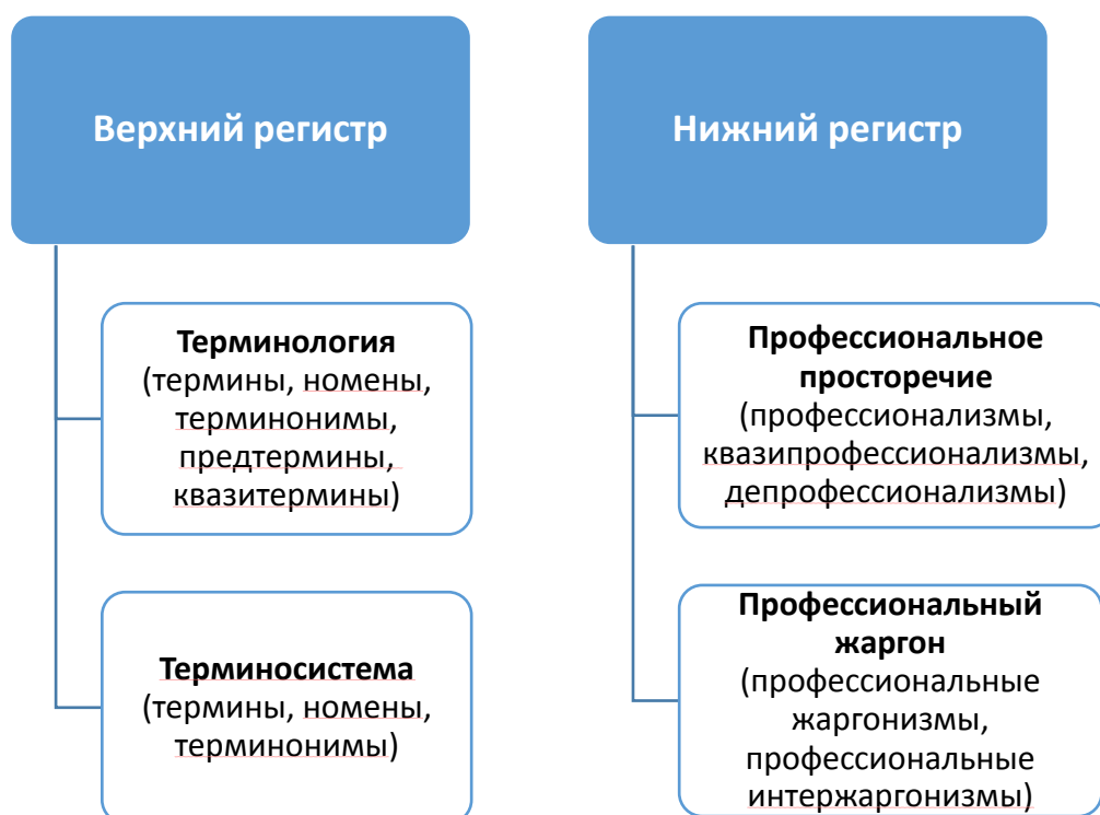
Рис. 1. Структура подъязыка работников гидроэнергетической отрасли

Цель исследования – представить многоаспектную характеристику специальной лексики нижнего регистра подъязыка работников гидроэнергетической отрасли.