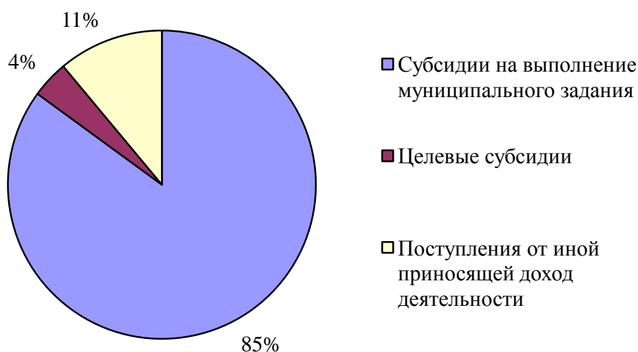
Рис. 3.2 –Доля показателей в общей сумме поступлений за 2020 год