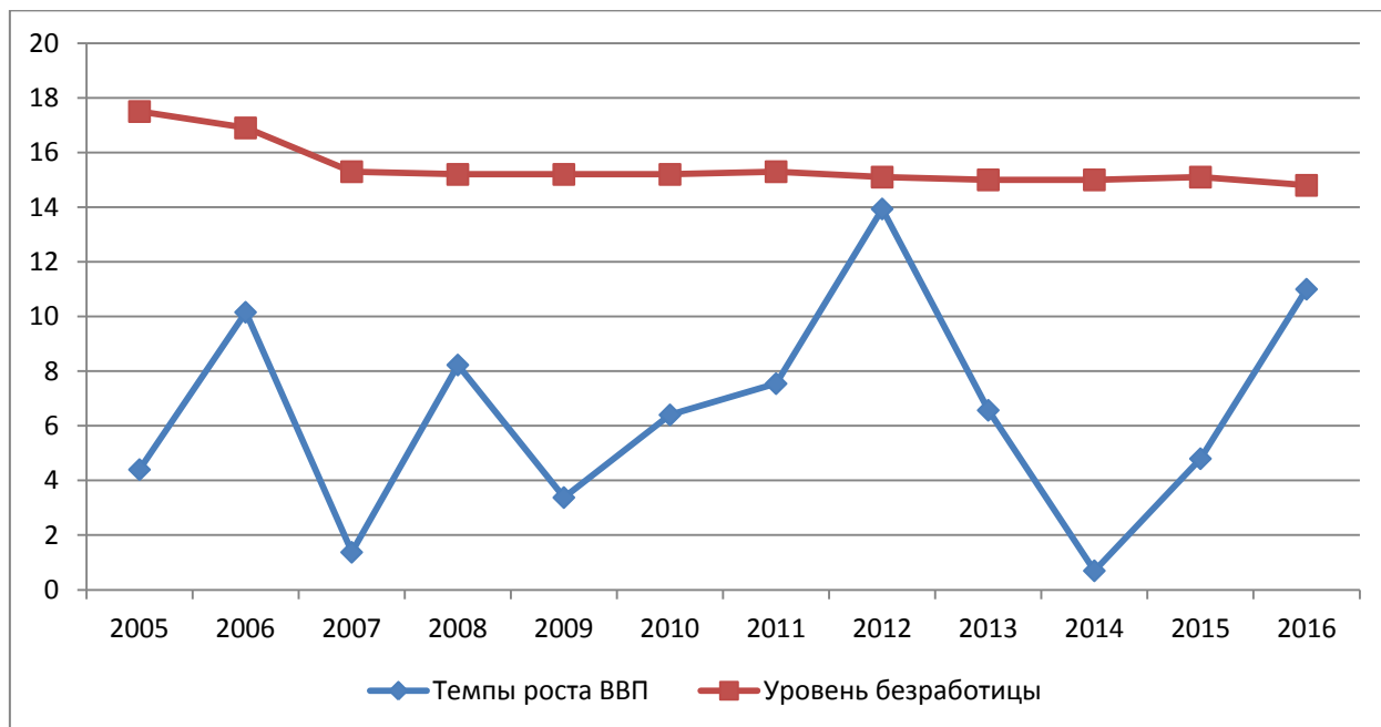
Рисунок 3.1 – Темпы роста ВВП и Уровень безработицы Республики Ирак, %

- учитывая активное военное противостояние, фактически актуальное на момент усиления политики «мягкой силы» США в регионе, инструментарий развития революционных настроений в Иране не был актуален для США. Потому основным инструментом «мягкой силы» в стране выступила гуманитарная помощь.