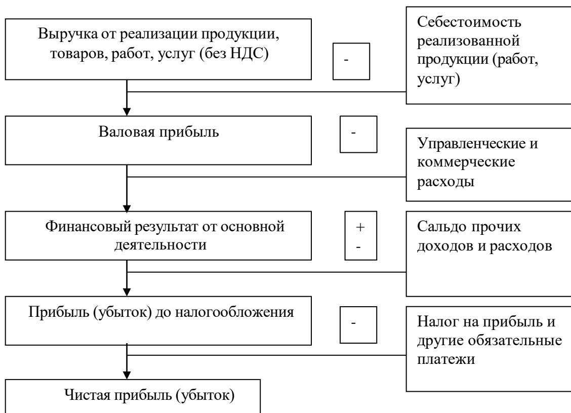
Рисунок 1 - Механизм формирования финансовых результатов

Механизм формирования финансовых результатов коммерческой организации представлен на рисунке 1.