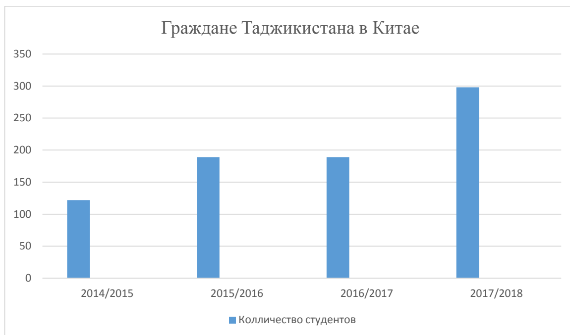
Рисунок 2 – Граждане Таджикистана в Китае

для выпускников школ, желающих приобрести высшее образование на территории Китая. Число молодых людей из стран региона обучающихся в КНР в 2017 году достигло фактически 30 тысяч человек, из них 5 тысяч обучались по гранту. Китай докладывает, что за десять лет численность одних только студентов из Казахстана увеличилась в 4 раза, достигнув отметки в 13 тысяч человек. Вторым по количеству является Кыргызстан, достигший в 2017 году отметки в 12 тысяч студентов, в свою очередь на территории последнего за тот же год получили высшее образование около 1200 человек из Китая. В рамках двухстороннего сотрудничества в Кыргызском национальном университете им. Ж. Баласагына открыт Кыргызско-Китайский факультет, на котором обучается около 1,3 тысяч человек. Медленно развивается сотрудничество с Таджикистаном. По данным Министерства обороны и науки республики, парадигма обучения студентов на территории Китая выглядит так 24 :